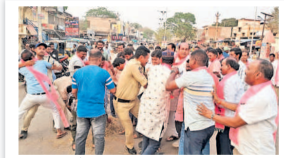
ఏటూరునాగారం: బీఆర్ఎస్ శ్రేణుల నుంచి దిష్టిబొమ్మను లాక్కుంటున్న పోలీసులు