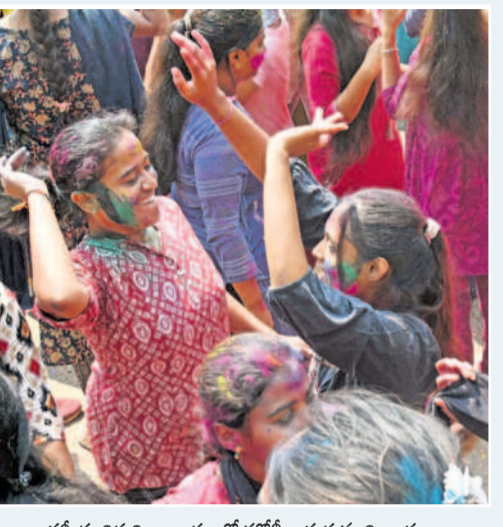
కాకతీయ విశ్వవిద్యాలయంలో హోలీ ఆడుతున్న విద్యార్థులు