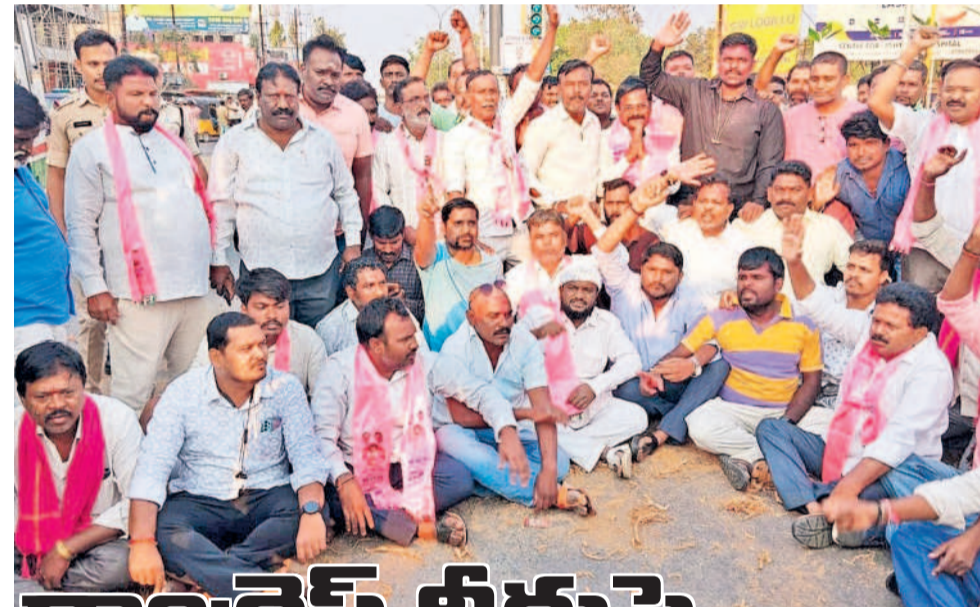
కాజీపేటలో రోడ్డుపై బెంగాలీలు నిరసన తెలుపుతున్న బీఆర్ఎస్ శ్రేణులు