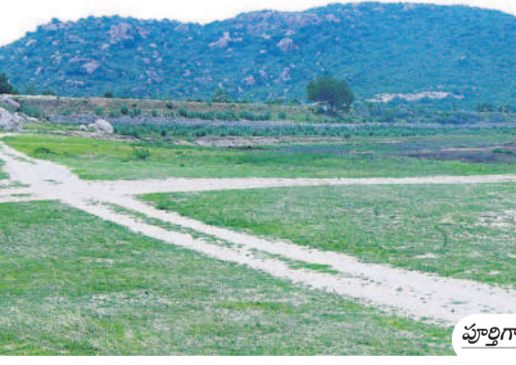
పూర్తిగా ఎండిపోయిన సంస్థాననారాయణపురం మేళ్లచెరువు

యాదాద్రి భువనగిరి, మార్చి 14 (నమస్తే తెలంగాణ) : పాలకుల నిర్లక్ష్యం రైతుల పాలిటా శాపంగా మారింది. కర్షకులకు పట్టణ మకోవడమే మానేసి కాంగ్రెస్ సర్కారు నల్లటి మంచుతున్నది. ఏడాది శ్రీతం నిడుకుండా ఉన్న చెరువులు నేడు ఎడారిలా కనిపిస్తున్నాయి. జిల్లాలో దాదాపు సగం చెరువులు ఎండిపోవడంతో దుర్భిక్ష పరిస్థితులు నెలకొన్నాయి. భూగర్భ జలాలు వేగంగా ఇంకిపోవడంతో బోర్లు, బావులు వట్టిపోయి పంటలు ఎండిపోతున్నాయి.