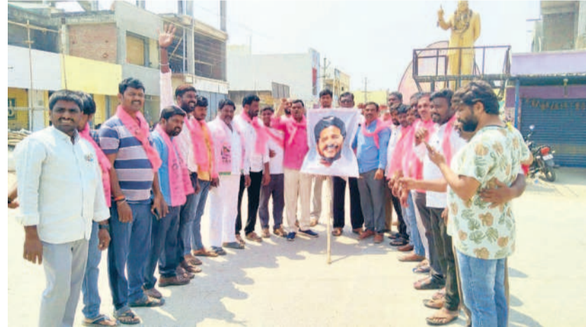
మునుగోడులో రేవంత్ రెడ్డి ఫైర్ చేసిన దహనం చేస్తున్న బీఆర్ఎస్ నాయకులు