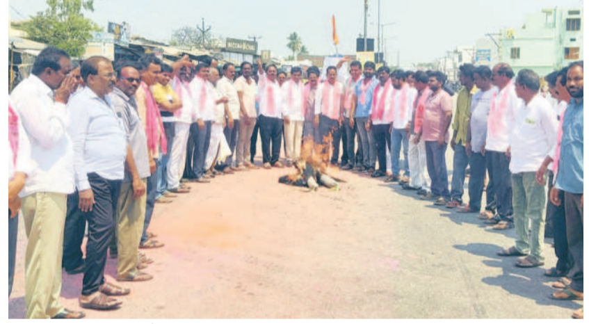
నేరేడుపల్లిలో సీఎం రేవంత్ రెడ్డి డిప్లిటోమ్మను దహనం చేస్తున్న బీఆర్ఎస్ నాయకులు