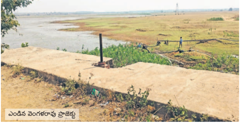
ఎండిన వెంగళరావు ప్రాజెక్టు

చంద్రగౌండ, మార్చి 15 : చంద్రగౌండ మండలం రైతులకు సాగునీటి కష్టాలు మొదలయ్యాయి. పడేళ్ల తరువాత మళ్ళీ ఆయిల్ ఇంజిన్లను ఆశ్రయించాల్సిన పరిస్థితి దాపురించింది. ఎందుకున్న పంటలను కాపాడుకునేందుకు కర్షకులు భగీరథ యత్నాలు చేయాల్సి వస్తోంది. ఇదివరకే తెగిన అలుగుకు కాంగ్రెస్ సర్కారు పరమర్శులు చేయని ఫలితం.. అన్నదాతలకు శాపంగా మారింది. రూ.వేలకు వేలు వెచ్చించి లీటర్లకు లీటర్లు ఆయిల్ను కొనుగోలు చేసి తీసుకొచ్చి ఇంజిన్లు నడిపించుకోవాల్సిన పరిస్థితి ఏర్పడింది. కిలోమీటర్ల మేర పైపులు ఏర్పాటు చేసుకొని పంటలకు నీటిని సరఫరా చేసుకోవాల్సిన దయనీయ దుస్థితి వచ్చింది.