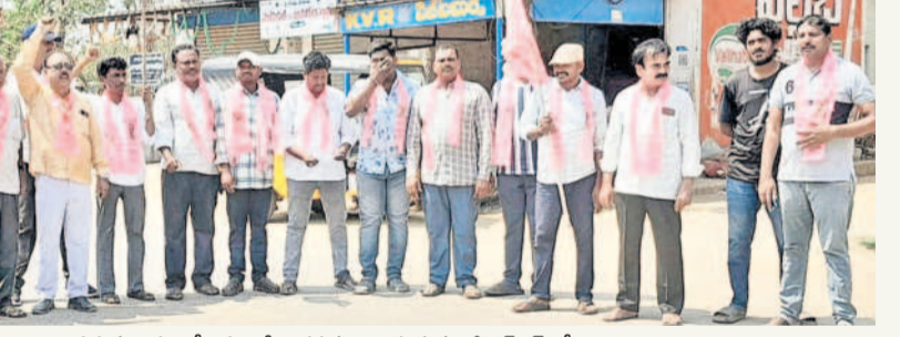
చర్ల మండల కేంద్రంలో నిరసన తెలుపుతున్న బీఆర్ఎస్ శ్రేణులు