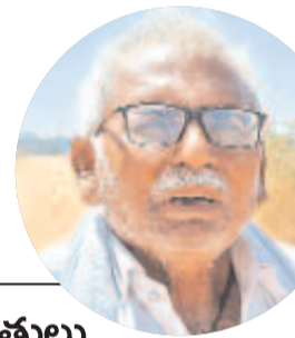
- అసెంబ్లీ సాక్షిగా ముఖ్యమంత్రి రేవంత్ రెడ్డి చేసిన ప్రకటన

కాళేశ్వరం నుంచి సూర్యాపేటకు చుక్కనీళ్లు పోలే సూర్యాపేట జిల్లాకు కాళేశ్వరం నుంచి చుక్కనీళ్లు రాలేదు. ఏదేండ్లపాటు వచ్చినవి శ్రీరాంసాగర్ నీళ్లే. ఆ నీటితోనే పంటలు సాగుచేసారు. గతంలో రాష్ట్రంలో ఎక్కడ పంటలు పండినా కాళేశ్వరం ప్రాజెక్టుతోనే అన్నదు. ఎన్నారేళ్లు కింద పండినా ఇంకెక్కడ పండినా కాళేశ్వరం నీళ్లే అన్నరు. ప్రాజెక్టు కుప్పకూలింది. లక్ష కోట్లు అవినయ్యాయి. కానీ ఈ ఏడాది కాళేశ్వరం లేకుండానే ఒక్క సీజన్ లోనే తెలంగాణ రైతులు 2.6 లక్ష మెట్రిక్ టన్నుల ధాన్యం పండింది.