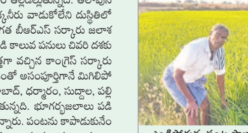
పొట్ట దళకు వచ్చిన వరి పొలానికి ట్యాంకర్ల ద్వారా నీరుందిస్తున్న రైతు

కొనరావుపేట, మార్చి 15 : కొనరావుపేట మండలం తల్వడిల్లుతున్నది. తలాపునే జల బాంధాగారం మల్కాపేట రిజర్వాయర్ ఉన్నా చుక్కనీరు వాడుకోలేని దుస్థితిలో మగ్గుతున్నది. సాగుగారం చేయడమే లక్ష్యంగా గత బీఆర్ఎస్ సర్కారు జలాశయాన్ని నిర్మించింది. బడము కాలువను పూర్తి చేసింది. కుడి కాలువ చున్నలు వివరిత దళకు తీసుకురావడం, అంతలోనే ప్రభుత్వం మారింది. కొత్తగా వచ్చిన కాంగ్రెస్ సర్కారు పట్టణంలోని పొట్ట దళకు తీయకపోవడంతో అసంపూర్ణిగానే మిగిలిపోవడంతో పల్లెలో సాగునీటి కటకు తీవ్రమైంది. నిజామాబాద్, దర్శారం, సుల్తాన, పల్లి మక్క, నాగారం, మామిడిపల్లి గ్రామాల్లో పంట ఎండుతున్నది. భూగర్భజలాలు పడి పోయి బోర్లు, బావులు ఇంకీపోగా, రైతులు ఆగమవుతున్నారు. పంటను కాపాడుకునేందుకు భగిరథ ప్రయత్నాలు చేస్తున్నారు. పలువురు రైతులు లక్షలకు లక్షల అప్పులు చేసి బోర్లు వేయిస్తున్నారని ద్వారా నీరు రాకపోవడంతో ఆవేదన చెందుతున్నారు. పలువురు డబ్బులు చెల్లించి ట్యాంకర్ల ద్వారా నీరు రాకపోవడంతో ఆవేదన చెందుతున్నారు. పలువురు పదిలెశారు. చేసేదేం లేక పశువులకు మేతగా వదిలేస్తున్నారు. తమను ప్రభుత్వం ఆదుకోవాలని గ్రామస్థులు రైతులు కోరుతున్నారు.