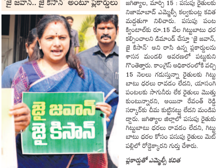
జిల్లా, మార్చి 15 : పసుపు రైతులకు నిజామాబాద్ ఎమ్మెల్సీ కల్వకుంట్ల కవిత మద్దతుగా నిలిచారు. పసుపు పంట క్లింబాలో రూ.15 వేల గిట్టుబాటు ధర కల్పించాలని డిమాండ్ చేస్తూ 'జై జవాన్, జై కిసాన్' అని రాసి ఉన్న ప్లకార్డులను శాసన మండలి ఆవరణలో పట్టుకుని గొంతెత్తారు. కాంగ్రెస్ అధికారంలోకి వచ్చి 15 నెలలు గడుస్తున్నా రైతులకు గిట్టు బాటు ధరల రావడం లేదని, యాసంగి పంటలకు సాగునీరు లేక రైతులు మొత్తం కుంటున్నారని, అయినా రేవంట్ రెడ్డి సర్కారీకు చీమ కుట్టినట్లు లేదని మండిపడ్డారు. జిల్లా జిల్లాలో పసుపు రైతులకు గిట్టుబాటు ధరల రావడం లేదని, గిట్టు బాటు ధరల కోసం పసుపు రైతులు మెట్ పల్లెలో రోడ్దెక్కిన గుర్తు చూశారు.