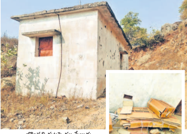
బొంబల్లి గట్టుపై గల పేలుడు పదార్థాల విక్రయ కేంద్రం