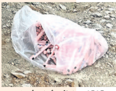
బొంబల్లో కొనుగోలు చేసిన జిల్లాలో స్ట్రీట్స్

కొండలు, పెద్ద పెద్ద బండలను పిండిగా మార్చే ప్రమాదకర పేలుడు పదార్థాల దందా పెద్దపల్లి జిల్లాలో జోరుగా సాగుతున్నది. సంబంధిత శాఖల నిర్లక్ష్యం.. పట్టణపులేమితో అక్రమ వ్యాపారం మూడు పూలు, ఆరు కాలులుగా విస్తరిస్తున్నది. అనుమతులు పేలబ జిల్లాలో స్ట్రీట్స్, డీ గార్డ్స్ (బత్తులు), డిటోనేటర్లను ఎవరికీ పదివారానికి డబ్బులు ఎక్కువైతే చాలు 'నో బిల్.. నో రిసిస్ట్' అన్నట్లుగా నడుస్తున్నది. రాత్రి వేళల్లో బైకులపై రవాణా చేయడం, కాలపరిమితి ముగిసిన కంకర క్యారీలకు సరఫరా చేస్తుండగా, ఇదే సమయంలో అసాంఘిక శక్తుల చేతుల్లోకి సైతం వెళ్తున్నట్లు ప్రచారం జరుగుతున్నది.