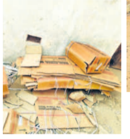
విక్రయ కేంద్రం వద్ద గల పేలుడు పదార్థాల కాటన్లు