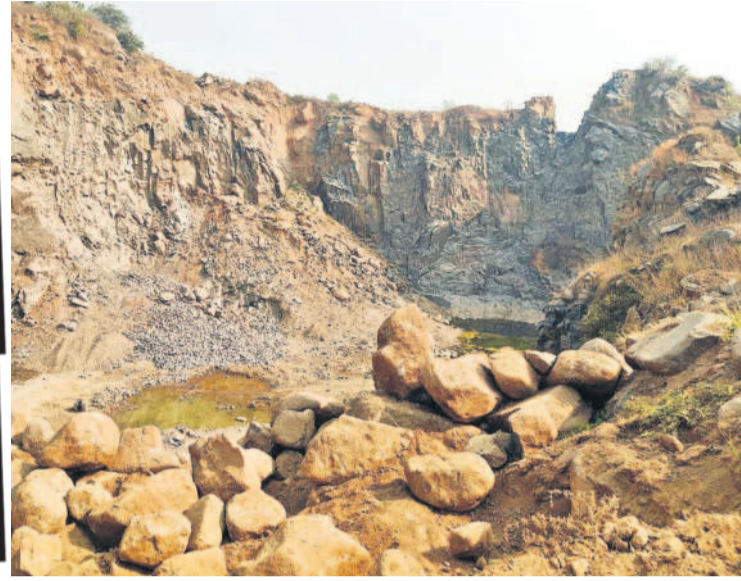
పేలుడు పదార్థాలతో తొలిదిన బొంబల్లి గట్టు

కొండలు, పెద్ద పెద్ద బండలను పిండిగా మార్చే ప్రమాదకర పేలుడు పదార్థాల దండా పెద్దపల్లి జిల్లాలో జోరుగా సాగుతున్నది. సంబంధిత శాఖల నిర్లక్ష్యం.. పట్టణపులేమిత్తో అక్రమ వ్యాపారం మూడు పూలు, ఆరు కాలులుగా విస్తరిస్తున్నది. అనుమతులు పేరిట జిల్లాలో స్ట్రీట్స్, డి గార్డ్స్ (బత్తులు), డిటోనేటర్లను ఎవరికీ పదితేవారికి డబ్బులు ఎక్కువైస్తే చాలు 'నో బిల్.. నో రిసిస్ట్' అన్నట్లుగా నడుస్తున్నది. రాత్రి వేళల్లో బైకులపై రవాణా చేయడం, కాలపరిమితి ముగిసిన కంకర క్యారీలకు సరఫరా చేస్తుండగా, ఇదే సమయంలో అసాంఘిక శక్తుల చేతుల్లోకి సైతం వెళ్తున్నట్లు ప్రచారం జరుగుతున్నది.