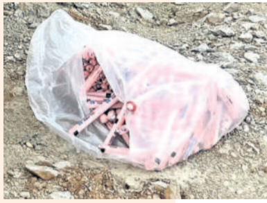
బొంబల్లిలో కొనుగోలు చేసిన జిల్లాలో స్ట్రీట్స్

కొండలు, పెద్ద పెద్ద బండలను పిండిగా మార్చే ప్రమాదకర పేలుడు పదార్థాల దండా పెద్దపల్లి జిల్లాలో జోరుగా సాగుతున్నది. సంబంధిత శాఖల నిర్లక్ష్యం.. పట్టణపులేమిత్తో అక్రమ వ్యాపారం మూడు పూలు, ఆరు కాలులుగా విస్తరిస్తున్నది. అనుమతులు పేరిట జిల్లాలో స్ట్రీట్స్, డి గార్డ్స్ (బత్తులు), డిటోనేటర్లను ఎవరికీ పదితేవారికి డబ్బులు ఎక్కువైస్తే చాలు 'నో బిల్.. నో రిసిస్ట్' అన్నట్లుగా నడుస్తున్నది. రాత్రి వేళల్లో బైకులపై రవాణా చేయడం, కాలపరిమితి ముగిసిన కంకర క్యారీలకు సరఫరా చేస్తుండగా, ఇదే సమయంలో అసాంఘిక శక్తుల చేతుల్లోకి సైతం వెళ్తున్నట్లు ప్రచారం జరుగుతున్నది.