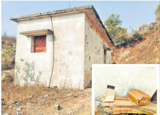
బొంబల్లి గట్టుపై గల పేలుడు పదార్థాల విక్రయ కేంద్రం

పేలుడు పదార్థాలను విక్రయించాలన్నా, వినియోగించాలన్నా ఇటు పోలీస్ శాఖ నుంచి, అటు మైనింగ్ శాఖ నుంచి పూర్తిగా అనుమతులు తీసుకోవాల్సి ఉంటుంది. విక్రయదారుడు ఎక్స్ ప్లోజివ్ లైసెన్స్ కలిగి ఉండడంతో పాటు వాటిని ఫార్మ్ ఫైర్ లైసెన్స్ కలిగిన వారికి ప్రత్యేకమైన ఎక్స్ ప్లోజివ్ ప్రొటెక్షన్ సెక్యూరిటీ వాహనంలో వాటిని తరలింపాల్సి ఉంటుంది. క్యారీల్లో షార్ట్ సైర్ లైసెన్స్ కలిగిన వారు మాత్రమే ఈ పేలుడు పదార్థాలను పేల్చాల్సి ఉంటుంది. అంతే కాదు సమయంలో అనేకమైన రక్షణ చర్యలను తీసుకోవాల్సి ఉంటుంది. కానీ ఇక్కడ విక్రయదారులకు, కొనుగోళ్లలో కానీ, రవాణాలో కానీ, వినియోగంలో కానీ పూర్తిగా నిబంధనలకు నిల్చు వదిలారు. పేలుడు పదార్థాలను రాత్రివేళ బొంబల్లి నుంచి బైకులపై నేరుగా క్యారీలకు తరలింపబడటం ప్రచారం జరుగు తున్నది. పర్యవేక్షించాల్సిన పోలీస్, మైనింగ్ శాఖలు పట్టణపులేమిత్తో లేదని విమర్శలు వస్తున్నాయి.