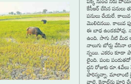
నిజామాబాద్ గ్రామంలో పొట్ల దళకు వచ్చిన పరిపాలనలో మేస్తున్న బిల్లులు

కోనరావుపేట, మార్చి 15 : కోనరావుపేట మండలం తల్లడిల్లుతున్నది. తలాపునే జల బాంధాగారం మల్కపేట రిజర్వాయర్ ఉన్నా చుక్కనీరు వాడుకోలేని దుస్థితిలో మగ్గుతున్నది. సాగుగారం చేయడమే లక్ష్యంగా గత బీఆర్ఎస్ సర్కారు జలాశయాన్ని నిర్మించింది. ఎడమ కాలువను పూర్తి చేసింది. కుడి కాలువ చునులు వివరి దళకు తీసుకురావడం, అంతలోనే ప్రభుత్వం మారింది. కొత్తగా వచ్చిన కాంగ్రెస్ సర్కారు పట్టణపులేమిత్తో పడం, తల్లడు మట్టికూడా తీయకపోవడంతో అసంపూర్ణాని మిగిలిపోవడంతో పల్లెలో సాగునీటి కలుకు తీవ్రమైంది. నిజామాబాద్, దర్శారం, సుల్తాన్, పల్లి మక్క, నాగారం, మామిడిపల్లి గ్రామాల్లో పంట ఎండతున్నది. భూగర్భజలాలు పడి పోయి బోర్లు, బావులు ఇంకీపోగా, రైతులు ఆగమవుతున్నారు. పంటను కాపాడుకునేందుకు భగిరథ ప్రయత్నాలు చేస్తున్నారు. పలువురు రైతులు లక్షలకు లక్షల అప్పులు చేసి బోర్లు వేయిస్తున్నారని గూరు నీరందించుకుంటున్నారు. కొన్ని బోర్లు పంటలు ఆశలు పదిలేశారు. చేసేదేం లేక పశువులకు మేతగా పదిలేస్తున్నారు. తమను ప్రభుత్వం ఆదుకోవాలని గ్రామస్థులు రైతులు కోరుతున్నారు.