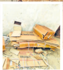
విక్రయ కేంద్రం వద్ద గల పేలుడు పదార్థాల కాటన్లు