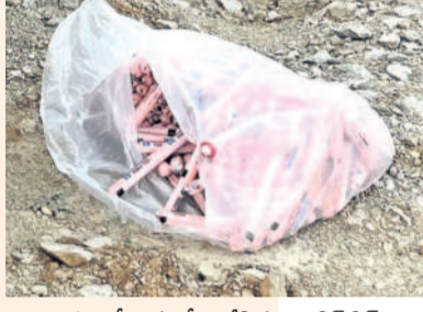
బొంబల్లో కొనుగోలు చేసిన జిల్లాలోని స్ట్రీట్స్

కొండలు, పెద్ద పెద్ద బండలను పిండిగా మార్చే ప్రమాదకర పేలుడు పదార్థాల దండా పెద్దపల్లి జిల్లాలో జోరుగా సాగుతున్నది. సంబంధిత శాఖల నిర్లక్ష్యం.. పట్టణపులేమిత్తో అక్రమ వ్యాపారం మూడు పూలు, ఆరు కాలులుగా విస్తరిస్తున్నది. అనుమతులు పేరిట జిల్లాలోని స్ట్రీట్స్, డి గార్డ్స్(బత్తులు), డిటోనేటర్లను ఎవరికీ పదితేవారికి డబ్బులు ఎక్కువైస్తే చాలు 'నో బిల్.. నో రిసిస్ట్' అన్నట్లుగా నడుస్తున్నది. రాత్రి వేళల్లో బైకులపై రవాణా చేయడం, కాలపరిమితి ముగిసిన కంకర క్యారీలకు సరఫరా చేస్తుండగా, ఇదే సమయంలో అసాంఘిక శక్తుల చేతుల్లోకి సైతం వెళ్తున్నట్లు ప్రచారం జరుగుతున్నది.