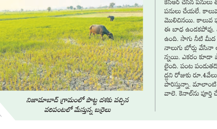
నిజామాబాద్ గ్రామంలో పొట్ట దళకు వచ్చిన వందలలో మేస్తున్న బిల్లులు

కోనరావుపేట, మార్చి 15 : కోనరావుపేట మండలం తల్లడిల్లుతున్నది. తలాపునే జల బాంధాగారం మల్కపేట రిజర్వాయర్ ఉన్నా చుక్కనీరు వాడుకోలేని దుస్థితిలో మగ్గుతున్నది. సాగుగారం చేయడమే లక్ష్యంగా గత బీఆర్ఎస్ సర్కారు జలాశయాన్ని నిర్మించింది. బడము కాలువను పూర్తి చేసింది. కుడి కాలువ చునులు వివరిత దళకు తీసుకురావడం, అంతలోనే ప్రభుత్వం మారినది. కొత్తగా వచ్చిన కాంగ్రెస్ సర్కారు పట్టణంలోని పాతపాతం, తల్లడి మట్టికూడా తీయకపోవడంతో అసంపూర్ణంగా మిగిలిపోవడంతో పల్లెలో సాగునీటి కటకట తీవ్రమైంది. నిజామాబాద్, దర్శారం, సుల్తాన్, పల్లి మక్క, నాగారం, మామిడిపల్లి గ్రామాల్లో పంట ఎండతున్నది. భూగర్భజలాలు పడిపోయి బోర్లు, బావులు ఇంకీపోగా, రైతులు ఆగమవుతున్నారు. పంటను కాపాడుకునేందుకు భగిరథ ప్రయత్నాలు చేస్తున్నారు. పలువురు రైతులు లక్షలకు లక్షల అప్పులు చేసి బోర్లు వేయిస్తున్నారని గుర్తు సీఎంఆర్ఎఫ్ ఆవేదన చెందుతున్నారు. పలువురు డబ్బులు చెల్లించి ట్యాంకర్ ద్వారా నీరందించుకుంటున్నారు. కొన్ని బోర్లు పంటలు ఆశలు పదిలేశారు. చేసేదేం లేక పశువులకు మేతగా పదిలేస్తున్నారు. తమను ప్రభుత్వం ఆదుకోవాలని గ్రామస్థులు రైతులు కోరుతున్నారు.