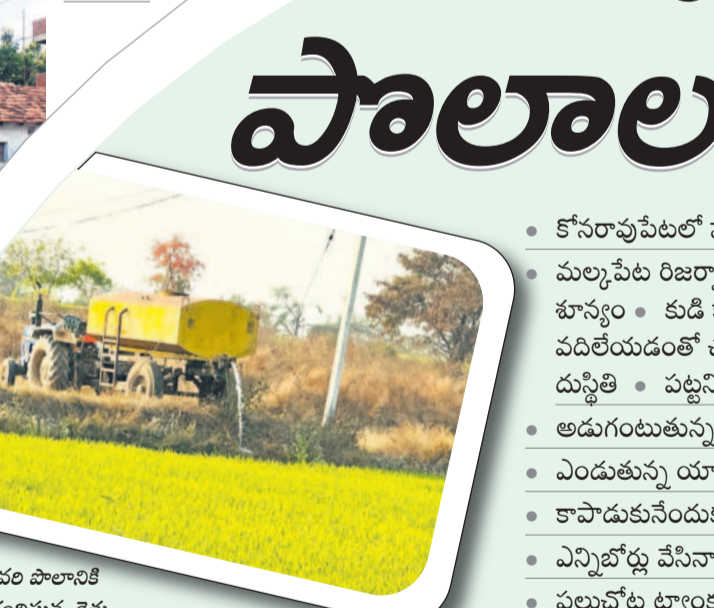
పొట్ట దళకు వచ్చిన వరి పొలానికి ట్యాంకర్ ద్వారా నీరందిస్తున్న రైతు

కోనరావుపేట, మార్చి 15 : కోనరావుపేట మండలం తల్లడిల్లుతున్నది. తలాపునే జల బాంధాగారం మల్కపేట రిజర్వాయర్ ఉన్నా చుక్కనీరు వాడుకోలేని దుస్థితిలో మగ్గుతున్నది. సాగుగారం చేయడమే లక్ష్యంగా గత బీఆర్ఎస్ సర్కారు జలాశయాన్ని నిర్మించింది. బడము కాలువను పూర్తి చేసింది. కుడి కాలువ చునులు వివరిత దళకు తీసుకురావడం, అంతలోనే ప్రభుత్వం మారినది. కొత్తగా వచ్చిన కాంగ్రెస్ సర్కారు పట్టణంలోని పాతపాతం, తల్లడి మట్టికూడా తీయకపోవడంతో అసంపూర్ణంగా మిగిలిపోవడంతో పల్లెలో సాగునీటి కటకట తీవ్రమైంది. నిజామాబాద్, దర్శారం, సుల్తాన్, పల్లి మక్క, నాగారం, మామిడిపల్లి గ్రామాల్లో పంట ఎండతున్నది. భూగర్భజలాలు పడిపోయి బోర్లు, బావులు ఇంకీపోగా, రైతులు ఆగమవుతున్నారు. పంటను కాపాడుకునేందుకు భగిరథ ప్రయత్నాలు చేస్తున్నారు. పలువురు రైతులు లక్షలకు లక్షల అప్పులు చేసి బోర్లు వేయిస్తున్నారని గుర్తు సీఎంఆర్ఎఫ్ ఆవేదన చెందుతున్నారు. పలువురు డబ్బులు చెల్లించి ట్యాంకర్ ద్వారా నీరందించుకుంటున్నారు. కొన్ని బోర్లు పంటలు ఆశలు పదిలేశారు. చేసేదేం లేక పశువులకు మేతగా పదిలేస్తున్నారు. తమను ప్రభుత్వం ఆదుకోవాలని గ్రామస్థులు రైతులు కోరుతున్నారు.