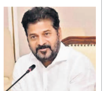
తాము ప్రయత్నిస్తున్నట్లు చెప్పారు.