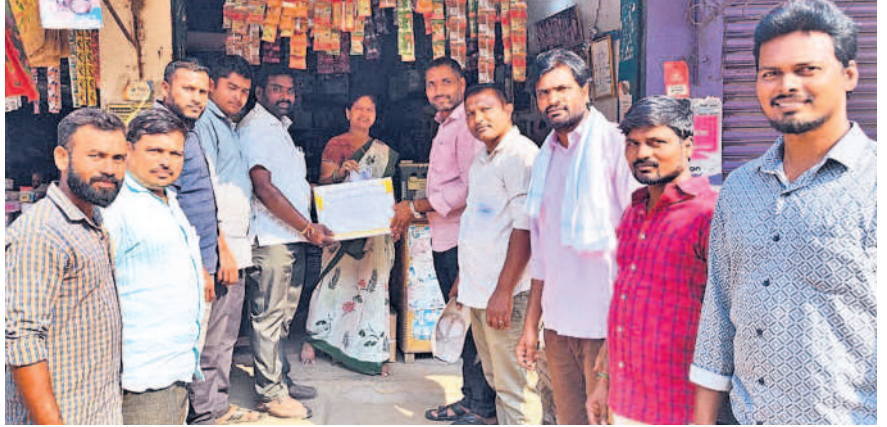
ఉపాధి హామీ ఫీల్డ్ అసిస్టెంట్లకు మూడు నెలలగా జీతాలు అందకపోవడంతో జిల్లా జిల్లా రాయికల్లో శనివారం భిక్షాటన చేసిన నిరసన తెలిపారు. కొందరు ఉద్యోగులకు జీతాలిచ్చి తమకు ఎందుకీవ్వడం లేదని ప్రశ్నించారు. కాంగ్రెస్ మ్యూనిసిపల్ కౌన్సిల్ పేనేట్లను అనుమతించి ఉద్యోగ భద్రత కల్పించాలని కోరారు. - రాయికల్