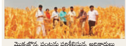
మొక్కజొన్న పంటల పరిశీలిస్తున్న అధికారులు

తిమ్మా జూబి, మార్చి 15: మండలంలోని ఇప్పలపల్లిలో ఎండిన పంటలను జిల్లా వ్యవసాయ అధికారి చంద్ర శేఖర్ పరిశీలించారు. శనివారం గ్రామంలో యాసంగి గోల్ రైతులు సాగు చేసిన మొక్కజొన్న, పరి పైదర్శన అయిన పరిశీలించారు. పంటలు ఎండిపోవడానికి గల కారణాలను అడిగి తెలుసుకున్నారు. ఎండలు ముందరకంటే బోధ్య ఒట్టి పోయాయని, దీంతో నీరు లేక పంటలు ఎండినట్లు రైతులు అధికారులకు తెలియజేశారు. పంటల వివరాలను నమోదు చేసుకున్నాయని, వీటికి సంబంధించిన నివేదిక ఉన్న తాది కారులకు అందజేస్తున్నట్లు రైతులకు తెలిపారు. ఆయన తో పాటు ఎంపీ వాసు, ఎవో కమిషనరీ ఉన్నారు.