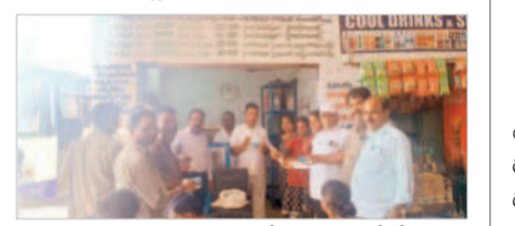
మజ్జిగ ప్యాకెట్ల అందజేస్తున్న డిపీ మేనేజర్