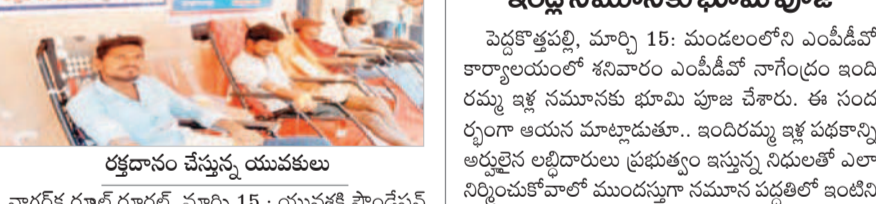
రక్తదానం చేస్తున్న యువకులు