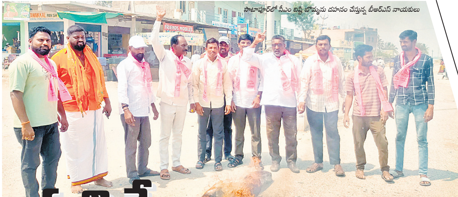
సాక్షాత్తుకోర్ సీఎం దిష్టి బొమ్మను దహనం చేస్తున్న బీఆర్ఎస్ నాయకులు