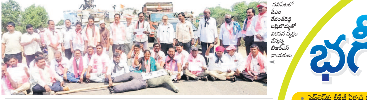
నవపేటలో సీఎం రేవంత్ రెడ్డి దిష్టిబొమ్మతో నిరసన వ్యక్తం చేస్తున్న బీఆర్ఎస్ నాయకులు