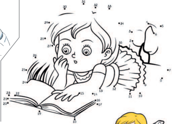
చుక్కల ఆధారంగా బొమ్మ గీసి, రంగులు వేయండి.