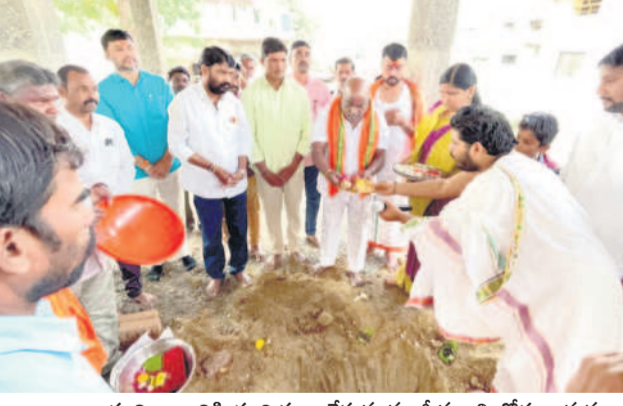
ఆలయ నిర్మాణానికి భూమిపూజ చేస్తున్న మాజీ మంత్రి జోగు రామన్న

ఎదులాపురం, మార్చి 16 : ప్రశాంతత జోగు రామన్న ఆస్థానం. ఆదిలాబాద్ పట్టణ ఆలయాల్లోనే లభిస్తుంది మాజీ మంత్రి జంబలం రణధిరవేంగల్లో శ్రీ సీతారామ