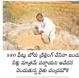
530 ఫీట్లు బోరు డ్రీలింగ్ చేసినా ఇంకా నీళ్లు మాత్రమే వచ్చాయని ఆవేదన చెందుతున్న రైతు పండ్రమూళి

దేవరకల్ల, మార్చి 16 : మహబూబ్ నగర్ జిల్లాలో మధ్యతరహా ప్రాజెక్టుగా పేరొందిన కోయిల్ సాగిని ఆయకట్టు సాగు ప్రకారంగా మారించి, ప్రాజెక్టు కుడి, ఎడమ కాలువల కింద 52,250 ఎకరాల ఆయకట్టు ఉన్నది. ఎడమ కాల్వ పరిధిలో 20 వేల హెక్టారులకు ఆయకట్టు ఉండగా.. ఈ యాసంగిలో దాదాపు 15 వేల ఎకరాల్లో రైతులు సాగుచేశారు. ఇటీవల జరిగిన వాటర్ బోర్డు సమావేశంలో ప్రాజెక్టు ఎడమ కాలువ కింద 4 వేల ఎకరాలు, కుడి కాలువ కింద 8 వేల ఎకరాలకు మాత్రమే నీటి వ్వాలని రెండు నెలల కిందట జరిగిన ఐడీబీ సమావేశంలో అధికారులు తీర్మానించారు. దీంతో ప్రాజెక్టులో పూర్తిస్థాయిలో నీరు ఉన్నా పంటలకు వరదని పరిస్థితి. పంటలు చేతికోచ్చే దశలో నీళ్లులేక ఎండిపోతుంటే రైతులు