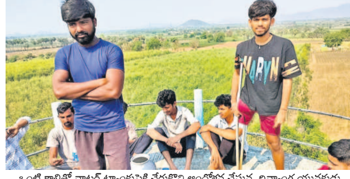
ఒంటి కాలితో వాటర్ ట్యాంకుపైకి చేరుకొని అందోళన చేస్తున్న దివ్యాంగ్ యువకుడు

జూలూరుపాడు, మార్చి 16: గత కేసీఆర్ ప్రభుత్వంలో తమ ఇళ్లకు శుభజలాలు అందించిన మిషన్ భగీరథ ట్యాంకును కాంగ్రెస్ ప్రభుత్వం పట్టించుకోవడం లేదంటూ భద్రాద్రి జిల్లా జూలూరుపాడు మండలం కాకర్ల పంచాయతీ దుర్గుతండావాసులు ఆగ్రహం వ్యక్తం చేశారు. ట్యాంకులకు నీళ్లు ఎక్కడైతే పుచ్చులు పగిలి నెలరోజులు దాటు తున్నా ప్రభుత్వం పట్టించుకుని పాపానపోలేదని ఆరోపిస్తున్నారు. ఆదివారం తండా వాసులంతా కలిసి ఖాసీ బిందెలతో ట్యాంకు పైకి