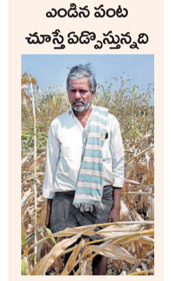
ఎండిన పంట చూస్తే ఏడ్చుకున్నది

అందోళన చెందుతున్నారు. రెండేండ్ల కిందట పుచ్చలమై సాగునీటితో బంగారు పంటలు పండితే.. కాంగ్రెస్ హయాంలో నీళ్లు లేక పంటలు ఎండుతున్నాయని రైతులు వాపోతున్నారు. మూడు నెలలుగా చేసిన రెక్కల కట్టం వ్యూహం అవుతుందని, రేయంబవళ్లు శ్రమించి వేసిన పంట చేతికొందే దశలో చేజారిపోతున్నదని ఆవేదన చెందుతున్నారు. 530 ఫీట్లు డ్రీల్ చేస్తే ఇంకా నీళ్లు.. మహబూబ్ నగర్ జిల్లా దేవరకల్ల