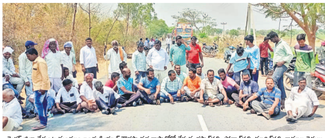
మెదక్ జిల్లా చేగుంట మండలం ఇందుప్రియల్ చౌరస్తా వద్ద రాస్తారోకో చేస్తున్న కనాచిపల్లి, పోతాచిపల్లి, మాచిపల్లి గ్రామాల రైతులు