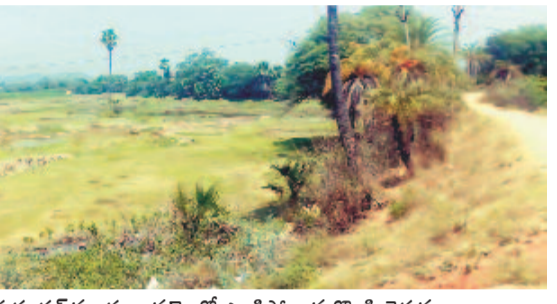
వేములవాడ రూరల్ మండలం వద్దంలో ఎండిపోయిన రోవి చెరువు

బలోయాలు. చుక్కనీరు లేక అధ్వానంగా కనిపిస్తున్నాయి. ఆందోళనలో రైతులు యాసంగికి ఎల్లంపల్లి నుంచి నీరు వస్తున్నది రైతులు నమ్మి పుష్కలంగా పని సాగించారు. కానీ, ప్రభుత్వం కేవలం నాలుగు చెరువులు మాత్రమే నింపడంతో మిగిలిన చెరువుల కింద రైతుల ఆశలు ఆవిరవుతున్నాయి. చెరువుల్లో నీరు లేని కారణంగా భూగర్భజలాలు పడిపోయి బోధ్ల, బావులు పట్టిపోయాయి. మరో 20 రోజుల్లో పంట చేతికి వచ్చే సమయంలో పంట ఎండిపోతుండడంతో రైతన్న కన్నీరు మున్నీరవుతున్నారు. బీఆర్ఎస్ ప్రభుత్వంలో మండలంలోని దాదాపు అన్ని చెరువులు నింపారని, కానీ, ఇప్పుడు పట్టింపుకునేవారే తీరని ఫలితంగా పంటలు ఎండిపోతున్నాయని రైతులు వాపోతున్నారు.