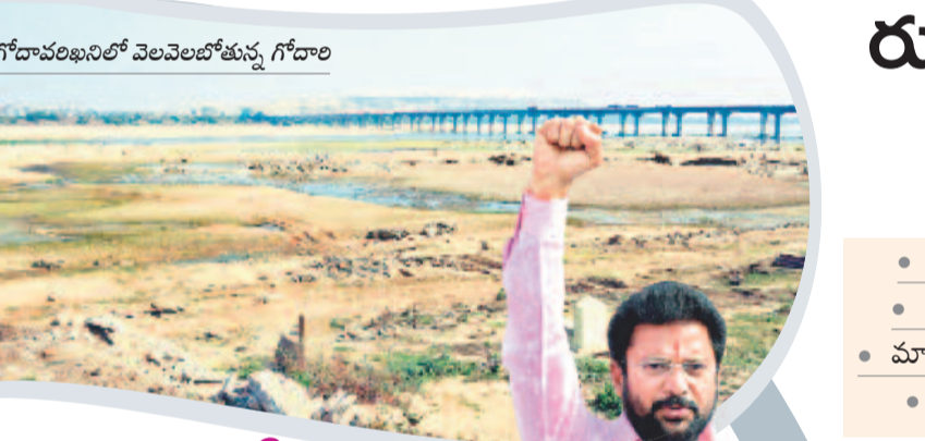
పిల్లవల 9: గోదావరిఖనిలో వెలవెలబోతున్న గోదా