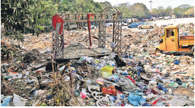
ఎన్టీఆర్ స్టేడియంలో పేరుకుపోయిన వ్యర్థాలు