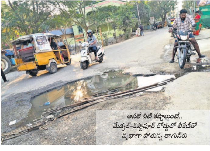
అవలే నీటి కష్టాలుండే.. మేడల్-కిష్టాపూర్ రోడ్లలో లీకేజీతో వృధాగా పోతున్న తాగునీరు

మేడల్ పట్టణంలో మిషన్ భగీరథ నీరు రాక మొదలు పరిస్థితి ఎంత దారుణంగా ఉండేది అంటే వేసవికి రెండు నెలల ముందే అంటే జనవరి చివరి వారం నుంచే ట్యాంకర్ల కోసం వేచిచూడాలి వచ్చింది. మున్సిపాలిటీకి చెందిన దాదాపు 200 బోర్డు ట్యాంకర్ల ద్వారా నీటి సరఫరా చేసినా.. నీటి అవసరాలు తీరేవి కావు. ప్రైవేట్ ట్యాంకర్ల వ్యాపారం జోరుగా సాగింది. బహుశా అంత స్థూల భవనాలు, అపార్ట్ మెంట్ల నివాసితులు అవసరాల కోసం రోజుకు మూడు, నాలుగు ట్యాంకర్ల వరకు తీసుకునే పరిస్థితి ఉండేది. ప్రతి రోజూ నీటి యుద్ధాల దర్శనమిస్తుంటే. బీఆర్ఎస్ సర్కారు మిషన్ భగీరథ పథకంలో భాగంగా మేడల్ మున్సిపాలిటీకి రూ.42 కోట్లు ప్రత్యేకంగా వెచ్చించి, మిషన్ భగీరథ నీటిని అందజేసింది. దీంతో నీటి సమస్య శాశ్వతంగా దూరమైంది. దీంతో ట్యాంకర్ల మూలన పడాలిస్తే పరిస్థితి ఏర్పడింది. పదేండ్ల తర్రాక కాంగ్రెస్ సర్కారు కొలుపుదీ రాక మళ్ళీ నీటి కష్టాలు మొదలయ్యాయి. దాదాపు 20 రోజులాగా నీటి కటకట మేడల్ లో ప్రారంభమైంది.