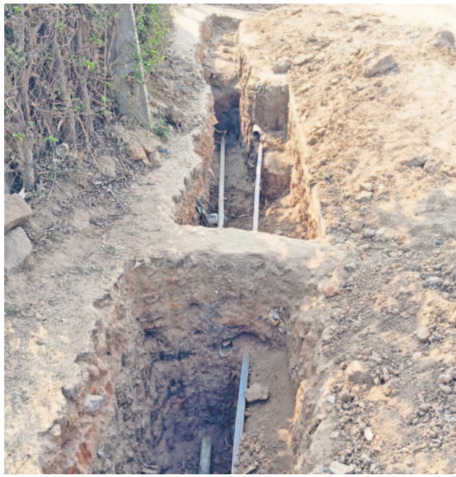
మిషన్ భగీరథ పైపైలైన్