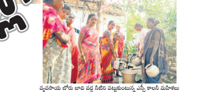
వ్యవసాయ బోరు బావి వద్ద నీటిని పట్టుకుంటున్న ఎస్సీ కాలనీ మహిళలు

షట్పల్లి ఎస్సీ కాలనీలో తాగు నీటి తిప్పలు ఆ ఎస్సీ కాలనీవాసులను తాగు నీటి సమస్య వెంటాడుతున్నది. ఇటు బోరు బావి పాడైపోయి.. అటు మిషన్ భగీరథ నీరు రాక పడరాని పాట్లు పడాల్సి వస్తున్నది. నిత్యం పనులన్నీ వదులుకొని స్థానికంగా ఉన్న వ్యవసాయబావి వద్దకు వెళ్లి నీరు తెచ్చుకోవాల్సిన దుస్థితి నెలకొన్నది. ● ఆరు నెలల క్రితం పాడైపోయిన బోరు బావి ● పైపైలైన్ ఉన్నా అందని మిషన్ భగీరథ నీరు ● పనులన్నీ వదులుకొని వ్యవసాయ బావి వద్దకు పరుగులు ● పట్టించుకోని అధికారులు, ప్రజాప్రతినిధులు ● గుక్కెడు నీటికోసం పడరాని పాట్లు పడుతున్న ఎస్సీలు