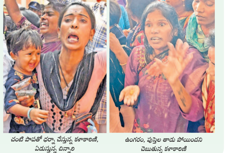
చంటి పాపతో ధర్మా చేస్తున్న కళాకారిణి, ఏడుస్తున్న చిన్నారి ఉంగరం, పుస్తకం తాడు పోయిందని చెబుతున్న కళాకారిణి