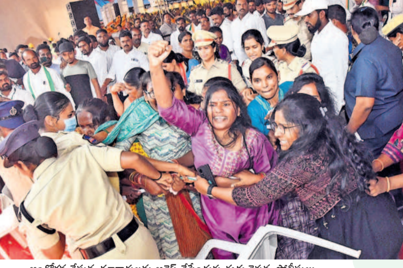
అందోళన చేస్తున్న కళాకారులను అరెస్ట్ చేసేందుకు ఈడ్చుకెళ్తున్న పోలీసులు