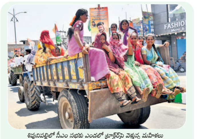
శివునిపల్లిలో సీఎం సభకు ఎండలో ట్రాక్టర్పై వెళ్తున్న మహిళలు