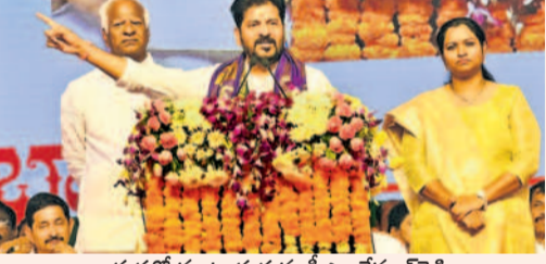
సభలో మాట్లాడుతున్న సీఎం రేవంత్ రెడ్డి