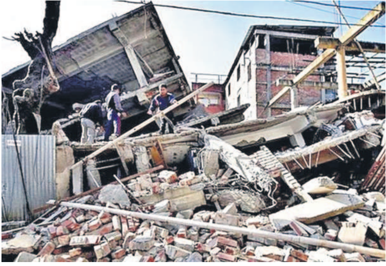
ఉత్తరాఖండ్లో భూకంప హెచ్చరిక వ్యవస్థ ఏర్పాటు