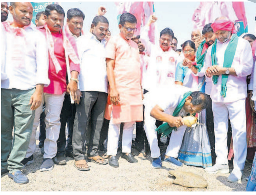
'ఐని' గోదావరితీరంలో గోదావరి మాతకు కొబ్బరికాయ కొట్టి పాదయాత్రను ప్రారంభిస్తున్న మాజీ మంత్రి కొప్పుల ఈశ్వర్, చిత్రంలో మాజీ ఎమ్మెల్యేలు కోరకంటి చందర్, పుట్ల మధుకర్, నాయకులు

ముఖ్యమంత్రి సహాయ నిధి చెక్కుల స్వాహా సాగి బట్టబయలైంది. ఈ మేరకు ఇద్దరిని అరెస్ట్ చేసి రిమాండ్ కు పంపారు. అందులో ఒకరు కాంగ్రెస్ నాయకుడు కావడం సంచలనం చేస్తున్నది. మానకొండలో అసెంబ్లీ నియోజకవర్గం ఇల్లంతకుండు మండలంలో జరిగిన సీఎంఆర్ఎఫ్ అక్రమాలపై 'సీఎంఆర్ఎఫ్ చెక్కుల స్వాహా' శిల్పకన ఈనెల 15న 'నమస్తే తెలంగాణ' ముఖం సంచికలో కథనం ప్రచురించింది. కొంతమంది కాంగ్రెస్ నాయకులు ఒక ముఠాగా ఏర్పడి.. సీఎంఆర్ఎఫ్ చెక్కుల డబ్బులను ఎలా స్వాహా చేస్తున్నారోని విషయాలను కంప్లెక్స్ కట్టిపెట్టే వివరాలను, ఒకరి చెక్కులను మరొక ఖాతాలో వేసుకుంటూ.. వారిని సామ్యు చేసుకుంటూ.. స్వాహా చేస్తున్న తీరును ఎండబెట్టింది.