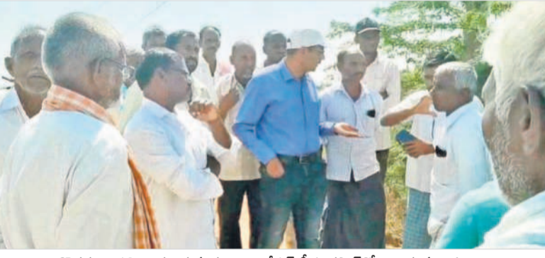
దొడగుంటపల్లి ఊర చెరువు కట్టకు ఇంజనీరింగ్ డి.ఈ గెనరల్ వారిని సర్దుబాటు రైతులు

దుకోవడం ఉద్దిక్తత వాతావరణాన్ని కల్పించింది. అనంతరం రైతుల సమావేశంలో వచ్చిన ఇరి గేట్ డి.ఈ ఎండ్ గెనరల్ కట్టకు గండి కొడ తొలగించడం రైతులు తీవ్రంగా వ్యతిరేకించారు. రెండు గ్రామాలకు చెందిన రైతు డి.ఈ సమస్య మాత్రం ఒక్కటే.. అదే నీళ్లు సమస్య. దీనిపై సోమవారం ఆరు గంటలపాటు రెండు గ్రామాల రైతులు నీటి కోసం తగవులాడుకోవడం కొత్త సమస్యకు తెర తేసింది.