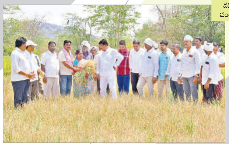
వనపర్తి జిల్లా పెద్దగూడెం తండాలో ఎండిన వరి పంటను పరిశీలిస్తున్న మాజీ మంత్రి నిరంజన్ రెడ్డి