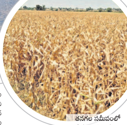
తనగల సమీపంలో ఎండిన మొక్కజొన్న పంట