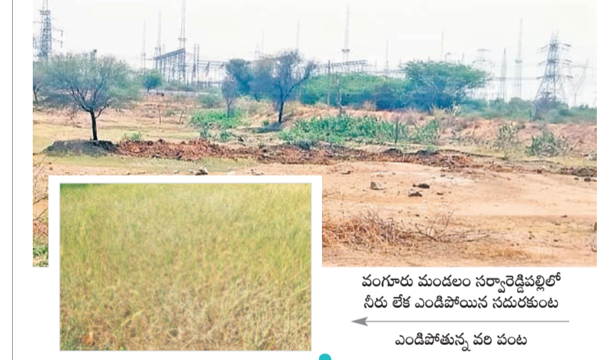
వంగూరు మండలం సర్కార్ రెవెన్యూలో నీరు లేక ఎండిపోయిన సమీప కంటలు

శను సంతరించుకునేవి. వ్యవసాయ బోర్డర్ల నీరు పుష్కలంగా ఉండేది. కానీ నేడు ఆ పరిస్థితి కానరావడం లేదు. ఈ యాసంగిలో రైతులు సాగు చేసిన వేరుశనగ పంట దిగుబడిలో బరువుపడినా.. మొక్కజొన్న పంట సాగు ప్రశ్నార్థకంగా మారింది. నీటి రాక నిలిచిపోవడంతో రైతులు ఆందోళన చెందుతున్నారు. గాజుర గ్రామంలో ఓ రైతు సాగు చేసిన మొక్కజొన్న నీళ్లు లేక ఎండిపోయింది. అలాగే చివరి నాటికి పొరిచేవారు. దీంతో వంగూరు మండలంలోని వివిధ గ్రామాల చెరువులు, కంటలు బలక