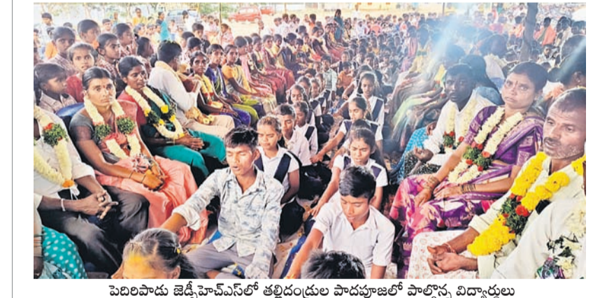
పెరిలపాడు జెడ్పీఐఎస్ఎల్లో తల్లిదండ్రుల పాదపూజలో పాల్గొన్న విద్యార్థులు