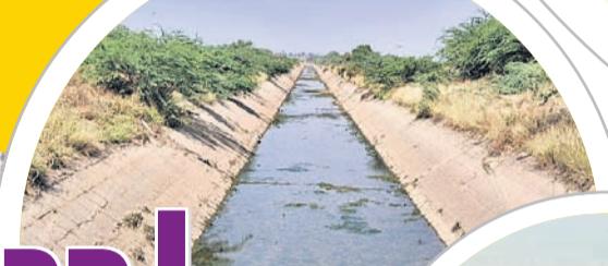
ఆర్టిఎస్ ప్రధాన కాల్వలో అడుగుంటిన నీళ్లు

వనపర్తి, మార్చి 17 (నమస్తే తెలంగాణ) : ప్రభుత్వ వైఫల్యంతోనే గ్రామంలో పంటలు ఎండిపో యారుని మాజీ మంత్రి సింగిరెడ్డి నిరంజన్ రెడ్డి పేర్కొన్నారు. రాష్ట్రంలో బాతు పూజాంతోనే పాలన నడపాలనుకుంటే చరిత్ర క్రమం చూసి సింగిరెడ్డి చెప్పారు. సోమవారం వనపర్తి మండలం పెద్దగూడెం తండాలో ఎండిన వరి పొలాలను మాజీ మంత్రి పరిశీలించి రైతులతో మాట్లాడారు. ఆనంతరం ఎండిన పంటలను ఉద్దేశించి ఆయన మాట్లాడుతూ రాష్ట్రంలో కంటింటి సరఫరాలో ప్రభుత్వం రైతాంగానికి ఇబ్బందులు కల్పించడం వల్ల ఎక్కువ పంటలు ఎండిపోతున్నాయన్నారు. కాంగ్రెస్ ప్రభుత్వం చెప్పిన హామీల్లో ఏ పదకం కూడా సవ్యంగా సాగడం లేదనారు.