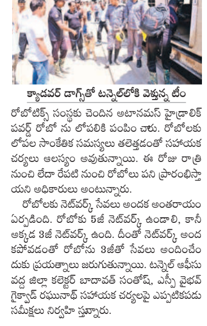
కాడపర్ డాక్టర్ టన్నెల్లోకి వెళ్తున్న టీం

అప్రెంటిస్, మార్చి 17 : డోమలవెంబు ఎన్ఎల్బీసీ సోదరులలో చిక్కుకున్న మిగిలిన ఏడుగురి ఆచూకీ కోసం రెస్క్యూ ఆపరేషన్ కొనసాగుతున్నది. డి-1, డి-2 ప్రదేశాల్లో తవ్వకాలు అభివృద్ధి చేశారు. టన్నెల్లో చిక్కుకున్న వారిని గుర్తించేందుకు 24 రోజులుగా సహాయక బృందాలు ఆన్సేషన్లు చేస్తున్నాయి. డి-1 ప్రదేశంలో భారీగా నీరు ఉలికి వస్తుండడంతో రెస్క్యూ ఆపరేషన్లు అభివృద్ధి చేశారు. టన్నెల్లో చిక్కుకున్న వారి ఆచూకీ ఎంతకూ జాడ తెలియకపోవడంతో మరోసారి కేవల కాడపర్ డాక్టర్ మరో సారి గుర్తించేందుకు టన్నెల్లోకి తీసుకెళ్లారు. సహాయక బృందాలు టన్నెల్లోకి వెళ్లి మిగిలిన ఆపరేషన్లు అభివృద్ధి చేశారు. డి-1, డి-2 ప్రదేశాల్లో తవ్వకాలు అభివృద్ధి చేశారు. టన్నెల్లో చిక్కుకున్న వారి ఆచూకీ ఎంతకూ జాడ తెలియకపోవడంతో మరోసారి కేవల కాడపర్ డాక్టర్ మరో సారి గుర్తించేందుకు టన్నెల్లోకి తీసుకెళ్లారు. సహాయక బృందాలు టన్నెల్లోకి వెళ్లి మిగిలిన ఆపరేషన్లు అభివృద్ధి చేశారు. డి-1, డి-2 ప్రదేశాల్లో తవ్వకాలు అభివృద్ధి చేశారు. టన్నెల్లో చిక్కుకున్న వారి ఆచూకీ ఎంతకూ జాడ తెలియకపోవడంతో మరోసారి కేవల కాడపర్ డాక్టర్ మరో సారి గుర్తించేందుకు టన్నెల్లోకి తీసుకెళ్లారు. సహాయక బృందాలు టన్నెల్లోకి వెళ్లి మిగిలిన ఆపరేషన్లు అభివృద్ధి చేశారు.