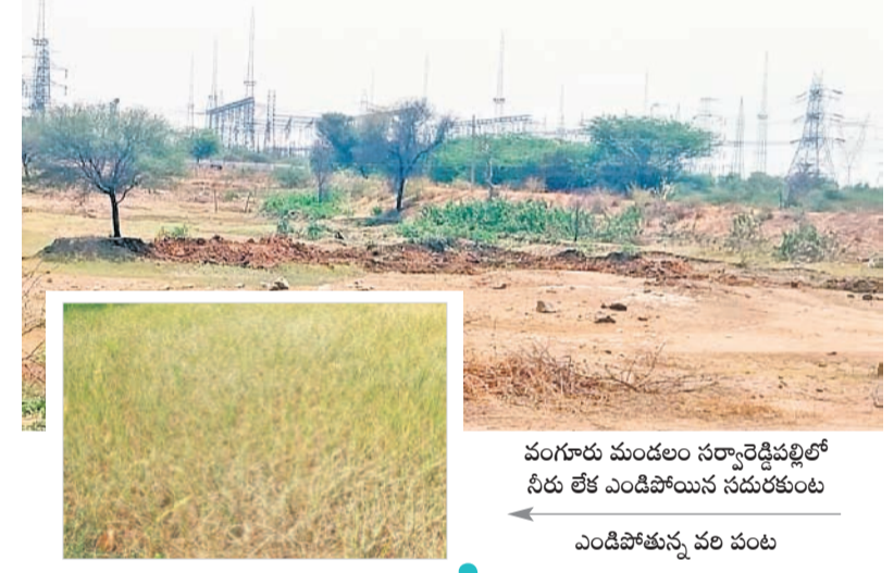
వంగూరు మండలం సర్కార్ రెవెన్యూలో నీరు లేక ఎండిపోయిన సమీపంలో ఎండిపోతున్న వరి పంట

శను సంతరించుకునేవి. వ్యవసాయ బోర్డర్ల నీరు పుష్కలంగా ఉండేది. కానీ నేడు ఆ పరిస్థితి కానరావడం లేదు. ఈ యాసంగిలో రైతులు సాగు చేసిన వేరుశనగ పంట దిగుబడిలో బయటపడినా.. మొక్కజొన్న పంట సాగు ప్రశ్నార్థకంగా మారింది. నీటి రాక నిలిచిపోవడంతో రైతులు అందోళన చెందుతున్నారు. గాజుర గ్రామంలో ఓ రైతుకు చేసిన మొక్కజొన్న నీళ్లు లేక ఎండిపోయింది. అలాగే చివరి నాటికి పారించేవారు. దీంతో వంగూరు మండలంలోని వివిధ గ్రామాలకు చెరువులు, కంటలు జలక