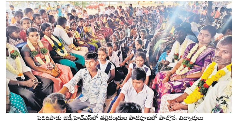
పెరిలపాడు జెడ్పీ హెచ్ఎస్ఆర్ తల్లిదండ్రుల పాదపూజలో పాల్గొన్న విద్యార్థులు