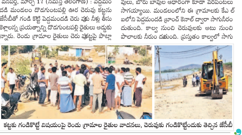
కట్టకు గండికొట్టే విషయంపై రెండు గ్రామాల రైతుల వాదనలు, చెరువుకు గండికొట్టేందుకు తెచ్చిన జేసీబీ

వరకు కట్ట దగ్గరకు పరుగు తీశారు. ఇప్పుడు రైతులు చెరువు కట్టకు గండిపై వాడుకుంటున్నారన్నారు. చివరకు ఇంగ్లీషు డీఈ గెనరల్కు సమాచారం ఇవ్వగా ఆయన కూడా వచ్చి దొడగుంటపల్లి చెరువు కట్టకు గండి పెట్టి మళ్లీ పూర్తి మోస్తూనే చెప్పడంతో రైతులు తిరగబడినంతవరకు చేశారు. ఎట్టి పరిస్థితిలోనూ గండి కొట్టేది లేదని, మిక్ జేవో ఉంటే తీసుకురండంటూ రైతులు డిఈని ఆక్షేపించారు. కాల్వకు నీరు అధికంగా తీసుకొస్తే.. ఒక రోజు అలగు పారి పెద్దమందడి చెరువు నీరు వెళ్తుందిని రైతులు డిఈతో వాదించారు. చివరకు చిలికి.. చిలికి గాలివానలా సమస్య ఇరి గేట్ కి ఈ మదుసూడన్ దృష్టికి వెళ్లడంతో హుటా హుటా ముటనాటితే చేరుకున్నారు. రెండు గ్రామాల రైతులకు సర్దుబాటు దొడగుంటపల్లి చెరువు తుండాలో నుంచి పెద్దమందడి చెరువు నీరు పోయే విధంగా మాట్లాడడంతో తాత్కాలికంగా సమస్యను సద్దుమణిగింది.