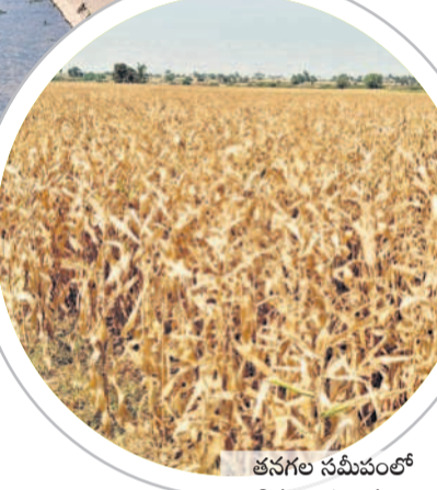
తనగల సమీపంలో ఎండిన మొక్కజొన్న పంట

నిల్వలు తగ్గి తుండడంతో ప్రధాన కాల్వలో పారుదల అంతం కావడం వల్ల అడుగుంటున్న నీటిని నిల్వలు అడుగుంటున్నాయి. ప్రభుత్వం కన్నడ ప్రభుత్వంపై ఒత్తిడి తెచ్చి ఏప్రిల్ రెండో వారం వరకు 2 టీఎంసీలు ఇన్వేస్ పంటలు చేతికి రావే పరిస్థితి కనిపించడం లేదు. ఈ పంటలకు ఏప్రిల్ రెండో వారం వరకు సాగునీరు అందించే పంటల దిగుబడి వస్తుంది. లేకుంటే రూ. లక్షల పెట్టుబడి చేతికొచ్చే పరిస్థితి కనిపించడం వల్ల రైతులు బాధపడుతున్నారు. ఆయకట్టులో ఎండిపోతున్న పంటలు