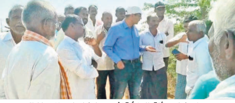
దొడగుంటపల్లి ఊర చెరువు కట్టకు ఇంగ్లీషు డీఈ గెనరల్తో వాదిస్తున్న రైతులు

దుకోవడం ఉద్దిక్తత వాతావరణాన్ని కల్పించింది. అనంతరం రైతుల సమావేశంలో వచ్చిన ఇరి గేట్ డిఈ ఎండ్ గెనరల్ కట్టకు గండి కొడ తొలగించడం రైతులు తీవ్రంగా వ్యతిరేకించారు. రెండు గ్రామాలకు చెందిన రైతు ప్రాతినిధులు సమన్వయం చేశారు. అదే నీళ్లు సమన్వయం చేశారు. ప్రభుత్వం నీళ్లు అందించేలా రెండు గ్రామాల రైతులు నీటి కోసం తగవులాడుకోవడం కొత్త సమస్యకు తెర తేసింది.