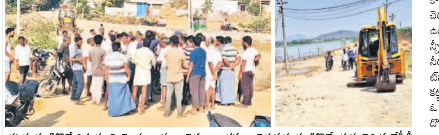
కట్టకు గండికొట్టే విషయంపై రెండు గ్రామాల రైతుల వాదనలు, చెరువుకు గండికొట్టేందుకు తెచ్చిన జేసీబీ

సీరు తగ్గుతూ వస్తుంది. ఈ పరిస్థితిలో దోడగంట పల్లి ఊర చెరువు కింద దాదాపు 300 ఎకరాలు పరి ఉన్నది. వీరికి ఇంకా నెల రోజులు నీరు పారితే తప్పా ఆయన కూడా వచ్చి దోడగంటపల్లి చెరువు కట్టకు గండి పెట్టే మళ్లీ పూడ్చి మోసుకుని వెళ్లడంకంటే రైతులు తీరగొడవింపలేకపోయారు. ఎల్లి పరిస్థితిలోనూ గండి కొట్టె లేదని, మీకో జోజు ఉంటే తీసుకురండంకంటే రైతులు డిక్షు కట్టెలు వారు. కాల్వకు నీరు అధికంగా తీసుకొస్తే, ఒక రోజు అలుగు పాక పెట్టెమండడి చెరువు నీరు వెళ్లకపోతే రైతులు డిక్షు వారు. కాల్వకు నీరు అధికంగా తీసుకొస్తే, ఒక రోజు అలుగు పాక పెట్టెమండడి చెరువు నీరు వెళ్లకపోతే రైతులు డిక్షు వారు.