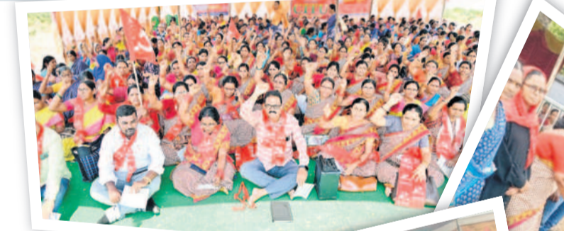
మంచిర్యాల కలెక్టరేట్ ఎదుట..