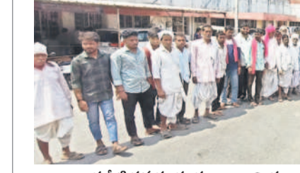
తాగునీటి సమస్య పరిష్కరించాలని ప్రజావాణికి తరలివచ్చిన సుంగాపూర్ గ్రామస్థులు

ఆదిలాబాద్, మార్చి 17(నమస్తే తెలంగాణ) : నీటి సమస్యను పరిష్కరించాలని సుంగాపూర్ కార్యకర్తలు సమరభేరి మోగించారు. ఏకంగా ఊరంతా కదిలారు. దాదాపు 100 మందికిపైగా కలెక్టరేట్ కు తరలివచ్చారు. ప్రజావాణిలో కలెక్టరేట్ కు వినతిపత్రం అందించారు. గ్రామస్థులు మాట్లాడుతూ.. తాగునీరు, సాగు నీటికి అవస్థలు పడుతున్నాయని తెలిపారు. వ్యవసాయ పనులు మానుకుని పొద్దుతా నీళ్లు మోసుకోవాల్సిన దుస్థితి నెలకున్నదని ఆవేదన చెందారు. నీటి కొరత కారణంగా ఇతర గ్రామాల తల్లిదండ్రులు ఆడ పిల్లలను మా గ్రామానికి ఇవ్వడానికి ఇష్టపడడం లేదని ఆందోళన చెందారు. నీటి సమస్యను పరిష్కరించాలని ప్రజాప్రతినిధులు, అధికారులను పలుమార్లు కోరినా ఫలితం లేదని ఆందోళన చెందారు. గ్రామంలో సాగునీటి వనరులు లేకపోవడంతో ఎండకాలంలో భూగర్భ జలాలు అందు చేస్తుండగా ఊరంతా నీటికోసం దానిపైనే ఆధారపడి వస్తుందని తెలిపారు. వ్యవసాయ పనులు మానుకుని పొద్దుతా నీళ్లు మోసుకోవాల్సిన దుస్థితి నెలకున్నదని ఆవేదన చెందారు. నీటి కొరత కారణంగా ఇతర గ్రామాల తల్లిదండ్రులు ఆడ పిల్లలను మా గ్రామానికి ఇవ్వడానికి ఇష్టపడడం లేదని ఆందోళన చెందారు. నీటి సమస్యను పరిష్కరించాలని ప్రజాప్రతినిధులు, అధికారులను పలుమార్లు కోరినా ఫలితం లేదని ఆందోళన చెందారు. గ్రామంలో సాగునీటి వనరులు లేకపోవడంతో ఎండకాలంలో భూగర్భ జలాలు అందు చేస్తుండగా ఊరంతా నీటికోసం దానిపైనే ఆధారపడి వస్తుందని తెలిపారు.