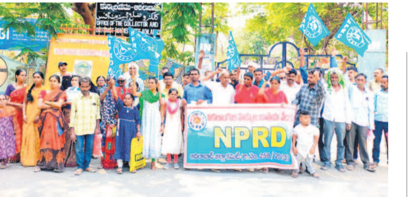
కలెక్టరేట్ ఎదుట ధర్మా చేస్తున్న దివ్యాంగులు