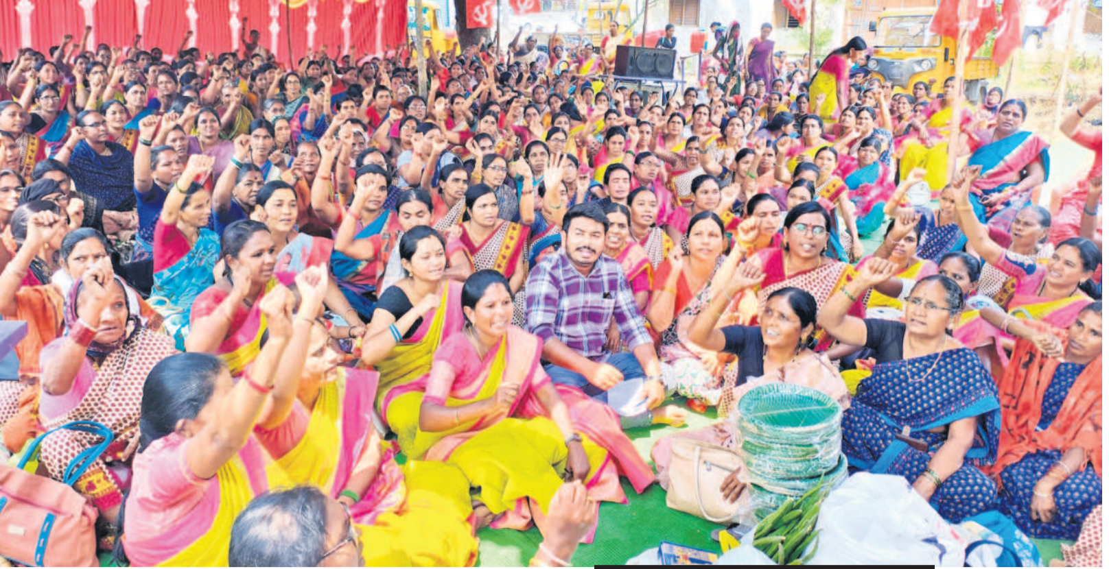
ఆదిలాబాద్ కలెక్టరేట్ ఎదుట ధర్మా చేస్తున్న అంగన్వాడీ తీవర్లు, హెల్పర్లు