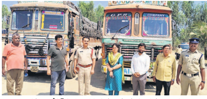
అక్షమంగా రేషన్ బియ్యం తరలిస్తున్న లాల్‌లను పట్టుకున్న అధికారులు