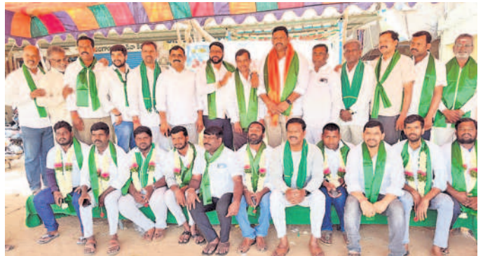
గుమ్మడిదలలో డంపింగ్ యార్డును రద్దు చేయాలని లిలే నిరాహార దీక్ష చేపట్టిన జేపీసీ యువసేన సభ్యులకు సమీపాదం తెలుపుతున్న రైతు జేపీసీ నాయకులు