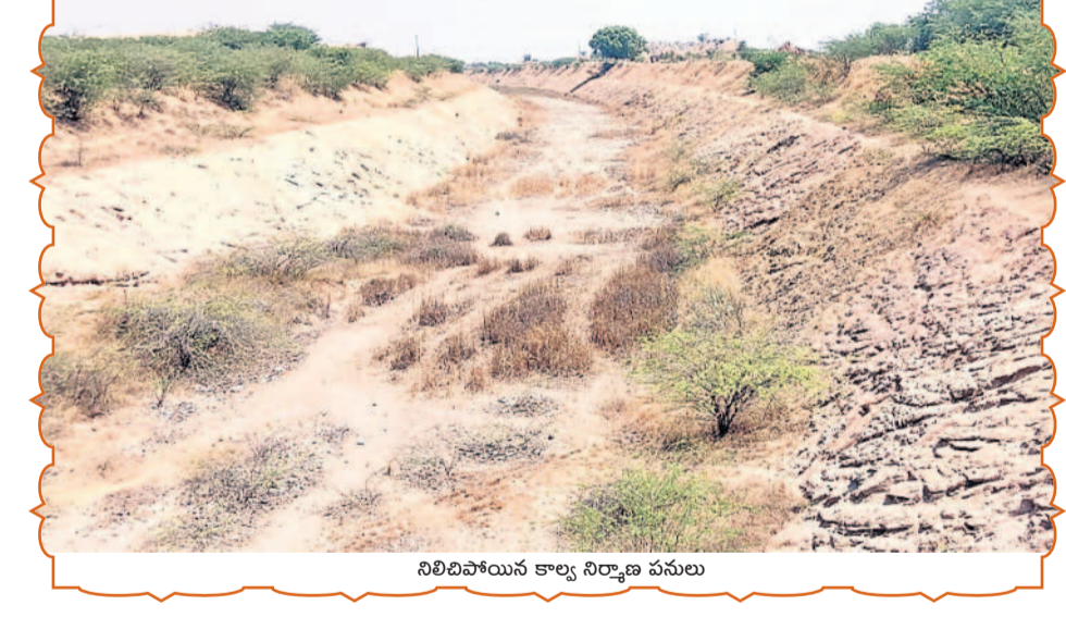
నిలిచిపోయిన కాల్వ నిర్మాణ పనులు