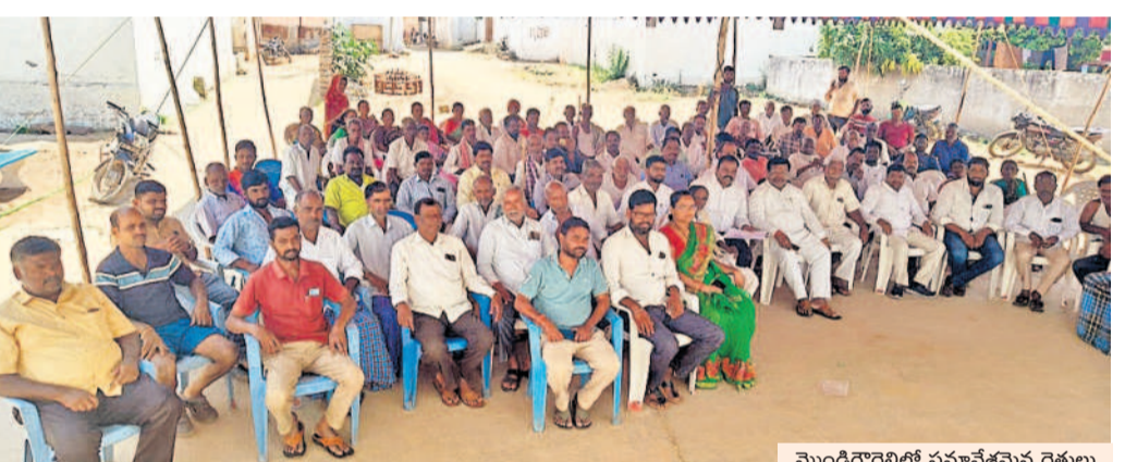
మొండిగొల్లిలో సమావేశమైన రైతులు