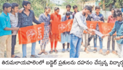
తిరుమలాలపాలెంలో బడ్జెట్ ప్రజలను దహనం చేస్తున్న విద్యార్థులు