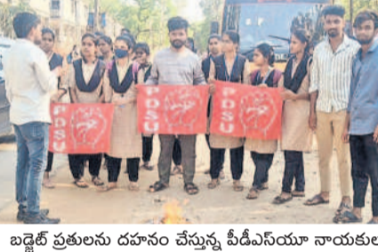
బడ్జెట్ ప్రజలను దహనం చేస్తున్న పీడీఎస్యూ నాయకులు

కొత్తగూడెం టౌన్/ తిరుమలాలపాలెం, మార్చి 19: తెలంగాణ బడ్జెట్లో విద్యారంగానికి ప్రభుత్వం మొండిచేయి చూపిందని పీడీఎస్యూ నాయకులు విమర్శించారు. రాష్ట్ర బడ్జెట్లో విద్యారంగానికి కాంగ్రెస్ ప్రభుత్వం తక్కువ శాతం నిధులను కేటాయించడాన్ని నిరసిస్తూ ఆ సంఘం నాయకులు కొత్తగూడెం జిల్లా కేంద్రంలోనూ, ఖమ్మం జిల్లా తిరుమలాలపాలెం మండలం బస్ స్టాండ్లోనూ బుధవారం బడ్జెట్ ప్రజలను దహనం చేశారు. ఈ సందర్భంగా ఆ సంఘం నేతలు మాట్లాడుతూ.. విద్యారంగానికి 15 శాతం బడ్జెట్ కేటాయిస్తామంటూ తన హ్యూనిఫెన్స్లో హామీ ఇచ్చిన కాంగ్రెస్.. ఇప్పుడు ఆ హామీని నెరవేర్చలేక పోయిందని విమర్శించారు. కేవలం 7.57 శాతం నిధులనే కేటాయించి విద్యారంగాన్ని నిర్లక్ష్యం చేస్తోందని దుయ్యబట్టారు.