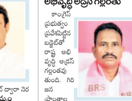
అభివృద్ధి అడ్డం గల్లంతు కాంగ్రెస్ ప్రభుత్వం ప్రవేశపెట్టిన బడ్జెట్లో రాష్ట్ర అభివృద్ధి అడ్డం గల్లంతుపడుతుంది. గిరి జన ప్రాంతాల అభివృద్ధికి మొండిచేయి చూపారు. 420 హామీలు ఈ బడ్జెట్లో కనుమరుగుయ్యాయి. వృద్ధులు, దివ్యాంగుల వెన్నెం పెంపు, మహిళలకు రూ.2,500, తులం బంగారం వంటి హామీలు బంగాళాఖాతంలో కలిపారు. ప్రజలకు రూ.15 వేలు, రైతు భరోసా, రైతు టీమా వంటి పథకాలకు మంగళం పాడారు. వ్యవసాయం, ఆరోగ్య శాఖకు నిధుల కేటాయింపు సరిగా లేదు.