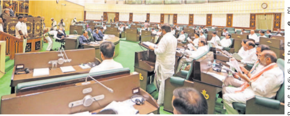
రైతుల్లో వ్యక్తమవుతోంది. అంతటా నిరాశ.. ఖమ్మం జిల్లాకు యూనివర్సిటీ లభిస్తుందని ఆశించిన విద్యార్థులకు ఈసారి కూడా నిరాశే మిగిలింది. గ్రామీణ ప్రాంతాల సమస్యలపై ప్రభుత్వం దృష్టి పెట్టలేదు. మౌలిక సదుపాయాల కల్పనకు అనుకున్న స్థాయిలో నిధులు లేవు. సాగునీటి ప్రాజెక్టులు, రహదారులు, వంతెనలు, కాలవల

బడ్జెట్లో కేటాయింపులు ఉమ్మడి ఖమ్మం జిల్లా ప్రజలను తీవ్ర నిరాశకు గురిచేశాయి. విద్య, సంక్షేమం, సాగునీటి రంగాల్లో పెట్టినట్లు అభివృద్ధిని భావించిన ఉమ్మడి ఖమ్మం జిల్లా ప్రజలకు.. ప్రభుత్వం ప్రత్యేక కేటాయింపులు ఏమీచేయకుండా రిక్షహస్తం చూపింది. లక్షలాది ఎకరాలకు సాగునీరుందివే లక్షలతో తెలంగాణ తొలి ముఖ్యమంత్రి కేసీఆర్ సీతారామ ప్రాజెక్టు నిర్మాణాన్ని ప్రారంభించారు. నిధులను వరదలా పారించారు. అయితే, ప్రాజెక్టు పనులు కొలిక్కివస్తున్న సమయంలో కాంగ్రెస్ ప్రభుత్వం నిర్మాణ అంచనా వ్యయాన్ని రూ.19 వేల కోట్లకు రూపొందించింది. అయినా అందుకు తగినట్లుగా బడ్జెట్లో నిధుల కేటాయింపు మాత్రం జరగలేదు. దీంతో రైతులకు అసహనం వ్యక్తమవుతోంది. నిరుదు ఆగస్టు 15న వైరూకు వచ్చిన ముఖ్యమంత్రి రేవంత్ రెడ్డి.. 2028 ఆగస్టు నాటికి సీతారామ ప్రాజెక్టును పూర్తిచేసి రైతులకు సాగునీరు అందిస్తామని ప్రకటించారు. కానీ ఈ బడ్జెట్ కేటాయింపులను పరిశీలిస్తే అక్షయ నుండి విడిచిపెట్టినట్లుగా ఉంది. దీంతో ఈ ప్రభుత్వం ఈ ప్రాజెక్టును ఏడాదిలోనే పూర్తిచేయగ