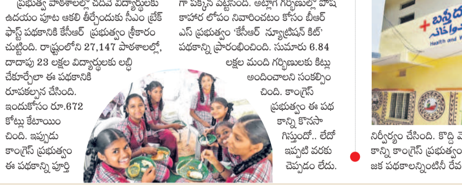
ప్రభుత్వ పాఠశాలల్లో పదివేల విద్యార్థులకు ఉదయం పూట ఆకలి తీర్చేందుకు సీఎం బ్రేక్ ఫాస్ట్ పథకానికి కేసీఆర్ ప్రభుత్వం ధీకారం చూపింది. రాష్ట్రంలోని 27,147 పాఠశాలల్లో, దాదాపు 28 లక్షల విద్యార్థులకు లబ్ధి చేకూర్చేలా ఈ పథకానికి రూపొందించిన సంఖ్యను కేసీఆర్ అమర్చి తొలగించింది. కాంగ్రెస్ ప్రభుత్వం ఈ పథకాన్ని కొనసాగిస్తుంది. లేదో ఇప్పటి వరకు చెప్పడం లేదు.