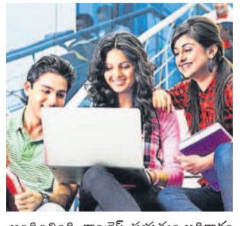
అందించింది. కాంగ్రెస్ ప్రభుత్వం అధికారంలోకి వచ్చిన తర్వాత, లేదో అప్పుడని అయితే ముందులో విద్యార్థులు ఉన్నారని, ఈసారి బడ్జెట్లో విదేశీ విద్యార్థిని పథకానికి నిధులు కేటాయించే అవకాశాలు ఉన్నాయని తొలుత అధికారులు అంచన వేశారు. కానీ, బడ్జెట్లో ఈ పథకం ప్రస్తావన లేకపోవడంతో విద్యార్థులు నిరాశకు లోనయ్యారు.

బీసీల కోసం పూర్తి పేరుతో, ఎస్సీ, ఎస్టీల కోసం అంబేద్కర్ పేరుతో ఓపర్టిన్ స్కాలర్ డిషింట్లను బీఆర్ఎస్ నర్కారు అందించింది. దీనినే విదేశీ విద్యార్థిని పథకం పేరిట కేసీఆర్ ప్రభుత్వం డీస్లై అమలు చేసింది. పేద బ్రాహ్మణులకు కూడా బ్రాహ్మణ సంక్షేమ పరిషత్ ద్వారా ఈ పథకాన్ని అమలు చేసింది. దాదాపు మూడు వేల మందికి ఓపర్టిన్ స్కాలర్ షిప్లు అందించింది. కాంగ్రెస్ ప్రభుత్వం అధికారంలోకి వచ్చిన తర్వాత, లేదో అప్పుడని అయితే ముందులో విద్యార్థులు ఉన్నారని, ఈసారి బడ్జెట్లో విదేశీ విద్యార్థిని పథకానికి నిధులు కేటాయించే అవకాశాలు ఉన్నాయని తొలుత అధికారులు అంచన వేశారు. కానీ, బడ్జెట్లో ఈ పథకం ప్రస్తావన లేకపోవడంతో విద్యార్థులు నిరాశకు లోనయ్యారు.