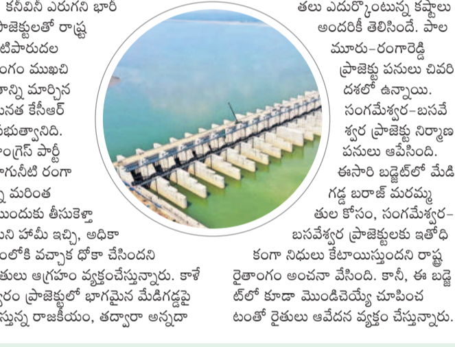
తలు ఎదుర్కొంటున్న కష్టాలు అందరికీ తెలిసిందే. పాలమూరు-రంగారెడ్డి ప్రాజెక్టు పనులు వివర దశలో ఉన్నాయి. సంగమేశ్వరం-బసవేశ్వరం ప్రాజెక్టు నిర్మాణ పనులు ఆపేసింది. ఈసారి బడ్జెట్లో మేడిగిట్ల బరాత్ మరమ్మతుల కోసం, సంగమేశ్వరం-రంగారెడ్డి ప్రాజెక్టులకు ఇతోధికంగా నిధులు కేటాయిస్తుందని రాష్ట్ర రైతుల అంచనా వేసింది. కానీ, ఈ బడ్జెట్లో కూడా మొండిచెయ్యే చూపించడం రైతుల ఆవేదన వ్యక్తం చేస్తున్నారు.

కనీసం ఎరుగు భారీ ప్రాజెక్టులతో రాష్ట్ర నీటిపారుదల రంగం ముఖ్యమంత్రి పునః కేసీఆర్ ప్రభుత్వానిది. కాంగ్రెస్ పార్టీ సాగునీటి రంగాన్ని మరల తీసుకోవాలని హామీ ఇచ్చి, అధికారంలోకి వచ్చాక ఘోషా చేసింది. రైతులు ఆ గ్రహం వ్యక్తం చేస్తున్నారు. కాశేశ్వరం ప్రాజెక్టులో భాగమైన మేడిగిట్లపై చేస్తున్న రాజకీయం, తద్వారా అన్నదా