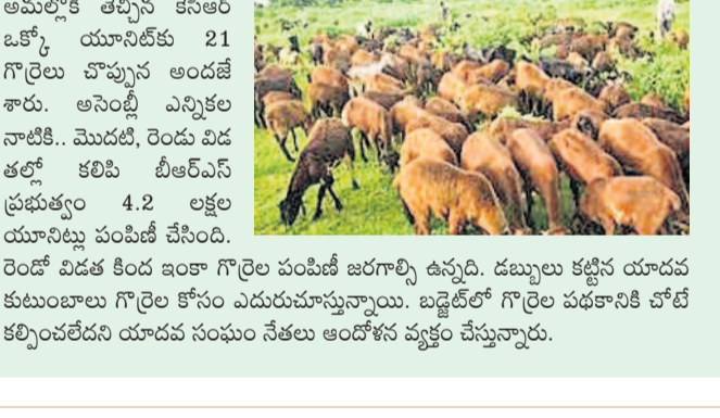
అటకెక్కిన గొర్రెల పథకం అమర్చి తెచ్చిన కేసీఆర్ ఒక్కో యూనిట్ కు 21 గొర్రెలు చొప్పున అందజేశారు. అసెంబ్లీ ఎన్నికల నాటికి, మొదటి, రెండు విడతల్లో కలిపి 4.2 లక్షల యూనిట్లు పంపిణీ చేసింది. రెండో విడత కింద ఇంకా గొర్రెల పంపిణీ జరగాల్సి ఉన్నది. డబ్బులు కట్టిన యూనిట్లకు కూటంబంది గొర్రెల కోసం ఎదురుచూస్తున్నాయి. బడ్జెట్లో గొర్రెల పథకానికి చోటి కల్పించలేదంటే యూనిట్ల సంఖ్య ఆంధోసన వ్యక్తం చేస్తున్నారు.

గొర్రెల పంపిణీ పథకం అమర్చి తెచ్చిన కేసీఆర్ ఒక్కో యూనిట్ కు 21 గొర్రెలు చొప్పున అందజేశారు. అసెంబ్లీ ఎన్నికల నాటికి, మొదటి, రెండు విడతల్లో కలిపి 4.2 లక్షల యూనిట్లు పంపిణీ చేసింది. రెండో విడత కింద ఇంకా గొర్రెల పంపిణీ జరగాల్సి ఉన్నది. డబ్బులు కట్టిన యూనిట్లకు కూటంబంది గొర్రెల కోసం ఎదురుచూస్తున్నాయి. బడ్జెట్లో గొర్రెల పథకానికి చోటి కల్పించలేదంటే యూనిట్ల సంఖ్య ఆంధోసన వ్యక్తం చేస్తున్నారు.