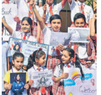
సునీతాకు జరిగిన విద్యార్థుల జేజేలు

ఏం జరిగిందంటే... అంతరిక్షంలోని పరిస్థితులకు అనుగుణంగా వ్యోమగామిల కోసం ప్రత్యేకంగా కొన్ని ఆహార పదార్థాలను నాసా తయారు చేస్తుంది. వీటిని ప్రతి మూడు నెలలకోసారి అక్కడి పంపిస్తారు. ఈ ఆహారం ఎక్కువగా ద్రవ రూపంలోనే ఉంటుంది. తాజా పదార్థాల తినే ఆనార్యం ఉండదు. శీతల పానీయాలను వ్యోమగామిలు వేడి చేసి తీసుకుంటారు. తగినన్ని క్యాలరీలు ఉండేందుకు పాడి రుచి పంపిస్తారు. చాలామంది టెక్ ఇంజనీర్లు పదార్థాలను వ్యోమగామిల తీసుకుంటారు.