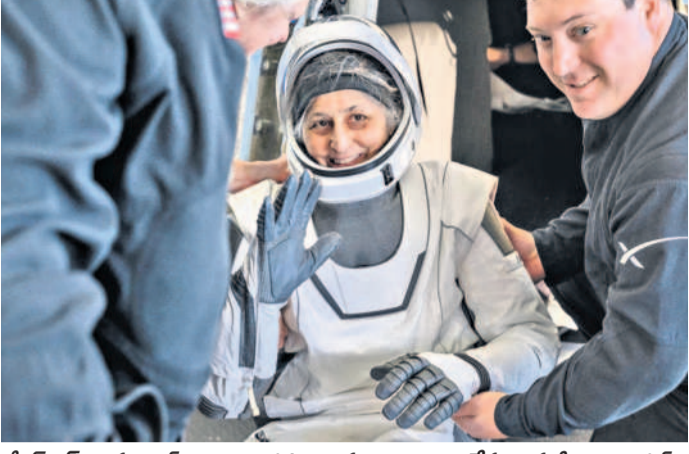
స్పేస్ ఎక్స్ కార్పొరేషన్ నుంచి బయటకు వస్తూ అభివాదం చేస్తున్న సునీతా విలియమ్స్

న్యూయార్క్: సుదీర్ఘ నిరీక్షణకు తెరపడింది. అంతర్జాతీయ అంతరిక్ష కేంద్రంలో 286 రోజులుగా బిక్కుబిక్కుగా భారత సంతతి నాసా వ్యోమగామి సునీతా విలియమ్స్, బన్ విల్సన్ సురక్షితంగా భూమికి చేరుకున్నారు. భారత కాలమానం ప్రకారం మొదలైన వేళ వజ్రమున 3.27 గంటలకు ఆమెరికాలోని ఫ్లోరిడా తీరంలో సముద్రతలాల్లో దిగారు. వారితోపాటు నాసాకు చెందిన కమాండర్ నిక్ హేగ్, రష్యా వ్యోమగామి అల్లాండర్ గోర్బునోవ్ కూడా భూమికి తిరిగివచ్చారు.