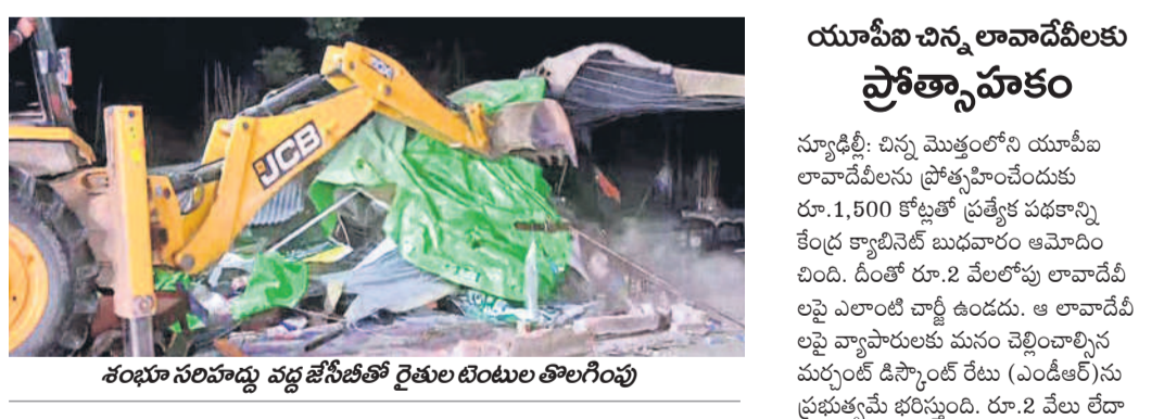
శంభూ సరిహద్దు వద్ద జేసీబీతో రైతుల బంటుల తొలగింపు