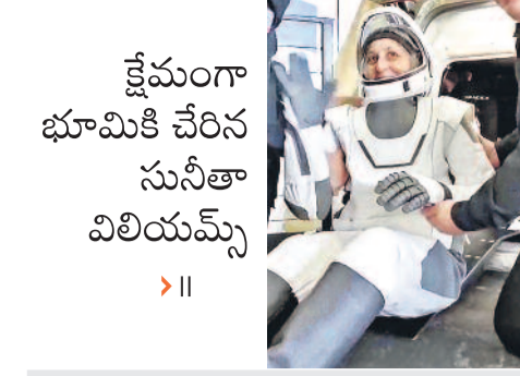
క్షేమంగా భూమికి చేరిన సునీతా విలియమ్స్