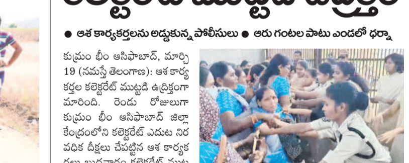
అకార్యకర్తలను అడ్డుకుంటున్న పోలీసులు

కుటుంబ టీఎస్ఆర్, మార్చి 19 (నమస్తే తెలంగాణ): అకార్యకర్తల కలెక్టర్ బి ముట్టడి ఉద్యమం మారింది. రెండు రోజులుగా కుటుంబ టీఎస్ఆర్ ఆసిఫాబాద్ జిల్లా కేంద్రంలోని కలెక్టర్ బి ముట్టడి ఉద్యమం నిరవధి దీక్షలు చేపట్టిన అకార్యకర్తల బుధవారం కలెక్టర్ బి ముట్టడికి పాల్గొన్నారు. అప్పటికి పోలీసులు వెళ్లడంతో మోహరించి ప్రధాన గేట్లను మూసివేశారు. దీంతో కలెక్టర్ తమ న్యాయం చేస్తామని హామీ ఇచ్చిన రేపంత్ రెడ్డి ఆధికారంలోకి వస్తూ తమ సమస్యలను పట్టించుకోవడం లేదని ఆరోపించారు. అకార్యకర్తలకు రూ.18 వేల నిధిప్రవేశనం వందలాది మంది అకార్యకర్తల బలైతాయింది ప్రధాన గేట్లను మూసివేశారు. దీంతో కలెక్టర్ తమ న్యాయం చేస్తామని హామీ ఇచ్చిన రేపంత్ రెడ్డి ఆధికారంలోకి వస్తూ తమ సమస్యలను పట్టించుకోవడం లేదని ఆరోపించారు. అకార్యకర్తలకు రూ.18 వేల నిధిప్రవేశనం వందలాది మంది అకార్యకర్తల బలైతాయింది ప్రధాన గేట్లను మూసివేశారు. దీంతో కలెక్టర్ తమ న్యాయం చేస్తామని హామీ ఇచ్చిన రేపంత్ రెడ్డి ఆధికారంలోకి వస్తూ తమ సమస్యలను పట్టించుకోవడం లేదని ఆరోపించారు. అకార్యకర్తలకు రూ.18 వేల నిధిప్రవేశనం వందలాది మంది అకార్యకర్తల బలైతాయింది ప్రధాన గేట్లను మూసివేశారు. దీంతో కలెక్టర్ తమ న్యాయం చేస్తామని హామీ ఇచ్చిన రేపంత్ రెడ్డి ఆధికారంలోకి వస్తూ తమ సమస్యలను పట్టించుకోవడం లేదని ఆరోపించారు.