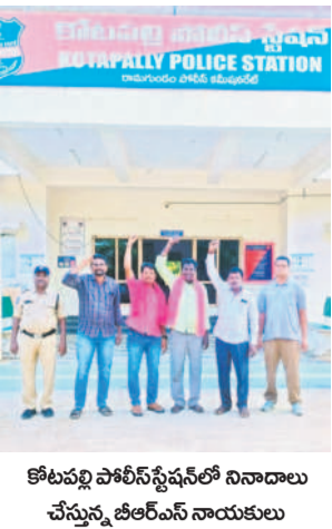
కోటపల్లి పోలీస్ స్టేషన్లో నినాదాలు చేస్తున్న బీఆర్ఎస్ నాయకులు

కోటపల్లి, మార్చి 19 : కాంగ్రెస్ ప్రభుత్వం ఎన్నికల సందర్భంగా ఇచ్చిన ఆరు గ్యారంటీలు అమలు చేతగాకనే అరెస్టులకు పాల్పడుతున్నదని బీఆర్ఎస్ నాయకులు ఆగ్రహం వ్యక్తం చేశారు. రాష్ట్ర బడ్జెట్ ప్రవేశపెడుతున్న సందర్భంలో మంచిగా జిల్లాలో వెనకాడగా, కోటపల్లి, కాసిపేట తదితర మండలాల్లో బీఆర్ఎస్ నాయకులు, కార్యకర్తలను ముందస్తుగా పోలీసులు అరెస్టు చేసి పోలీస్ స్టేషన్లకు తరలించారు. అభివృద్ధి పనులు బిల్లులు ఇవ్వాలని కోరుతూ అసెంబ్లీకి తరలిన మాజీ సర్పంచ్లను కూడా అదుపు లోకి తీసుకున్నారు. మరికొందరిని హాస్ ఆరెస్టు చేశారు. రాష్ట్ర ప్రభుత్వ తీరును నిరసిస్తూ నాయకులు నినాదాలు చేశారు. కాంగ్రెస్ ప్రభుత్వం ప్రవేశపెట్టిన బడ్జెట్ ప్రజలను మోసం చేసి బడ్జెట్ అని విమర్శించారు. రానున్న రోజుల్లో కాంగ్రెస్ ప్రభుత్వానికి ప్రజలు బుద్ధి చెబుతారని హెచ్చరించారు.