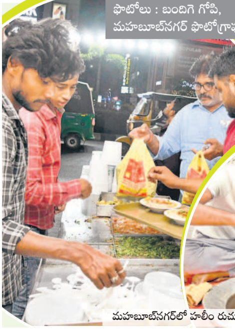
మహబూబ్ నగర్లో హాలీ రుమలను ఆహ్వానిస్తున్న ప్రజలు