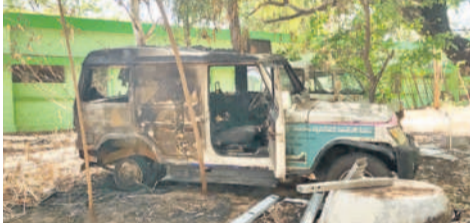
పాలెం దవాఖాన ఆవరణలో దగ్గమైన అంబులెన్స్