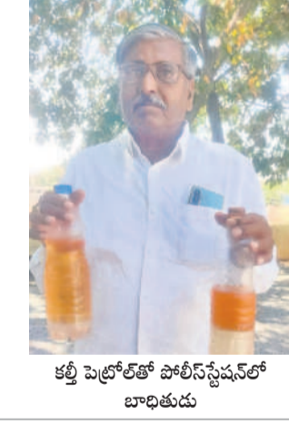
కత్తి పెట్రోల్ తో పోలీస్ స్టేషన్ లో బాధితుడు