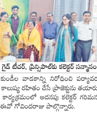
విద్యార్థి గైడ్ టీచర్, ప్రెసిడెంట్ కలెక్టర్ సన్మానం