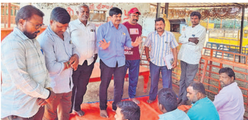
జియోగ్రాఫికల్ సర్వేకు సహకరించాలి

మహిళా దినోత్సవం, మార్చి 20 : జియోగ్రాఫికల్ సర్వేకు సహకరించాలి అంటూ ప్రభుత్వం పట్టించుకోవాలని వేడుకోలు. కమలాపై ఐదువేల కుటుంబాలు జీవనం న్యాయం తెలిపారు. ఈ కమలాపై ఆధారపడి ఐదువేల కుటుంబాలు జీవనం న్యాయం తెలిపారు. ఈ కమలాపై ఆధారపడి ఐదువేల కుటుంబాలు జీవనం న్యాయం తెలిపారు.