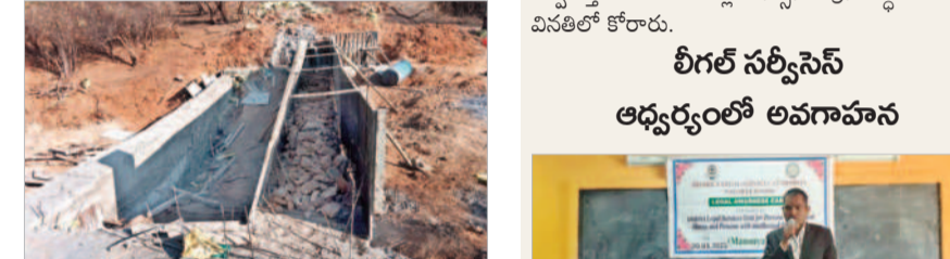
పలుగు రాష్ట్రాల్లో నిర్మించిన చెక్ డ్యాం

బిజినెస్ పర్సన్, మార్చి 20: మండలంలోని మమ్మాయిపల్లి శివారులోని మర్రిగుట్ట వద్ద నూతనంగా నిర్మిస్తున్న చెక్ డ్యాం పనులు నిబంధనలకు విరుద్ధంగా సాగుతున్నాయి. ప్రభుత్వ నియమ నిబంధనల ప్రకారం పూర్తిగా కంకర బెడ్లతో పనులు చేపట్టకుండా చెక్ డ్యాం మధ్యభాగంలో పలుగు రాష్ట్రం ని.పి చెక్ డ్యాంకు ఇటువైపులా కంకరమాట్ మేస్తూ నాణ్యత లేకుండా నిర్మాణం చేస్తున్నారు. దాదాపు రూ. 6.5 లక్షలతో చెక్ డ్యాంను నిర్మిస్తున్నారు. 3 ఫీట్ పాడవు, ఆరు ఫీట్ వెడల్పుతో నిర్మిస్తున్న చెక్ డ్యాం పూర్తిగా నాణ్యత లోపించి ఉన్నట్లు ఆలోచనలు వస్తున్నాయి. ఏటవాలు ప్రాంతాల్లో నీటి చెక్ డ్యాం అటవీ ప్రాంతాల్లో చెక్ డ్యాంను నిర్మిస్తున్నారు. అడవిలోని జంతువుల దాహార్థి తీవ్రమై చెక్ డ్యాంను నిర్మిస్తున్నారు. కాగా స్థానిక నక్షత్ర పార్టీని అధికారి చంద్రుడు సారథ్యంలో చెక్ డ్యాంను నిర్మాణంలో