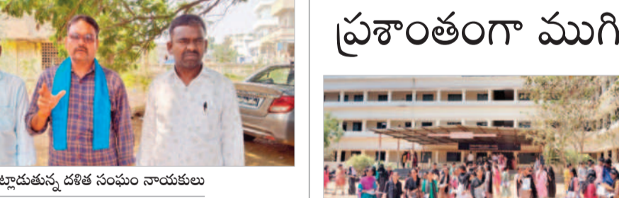
మాట్లాడుతున్న దళిత సంఘం నాయకులు