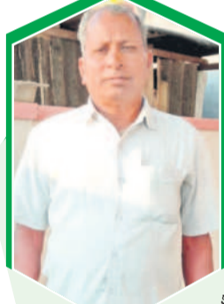
- పురుసులేటి, నిర్మల్ (యా)

నిర్మల్ (యా), మార్చి 20: మా అమ్మకు వయస్సు అయిపోయింది. ఇంట్లోనే ఉంటుంది. ప్రతి నెల అమెకు దవాఖాన ఖర్చులు, మందుల ఖర్చులు వున్నాయి. కాంగ్రెస్ పార్టీ ఎన్నికలప్పుడు ముందే లోకం రూ.4000 పంచన ఇస్తామని అని అందరం నమ్మించారు. పంచన పెంచలేదు మా అమ్మ అందుకు ఎంతో ఉపయోగపడతాయి అనుకున్న గవర్నమెంట్ ఏర్పాటు చేసి ఏడాదిన్నర అవుతున్నది. ఇప్పటికే పంచన పెంచలేదు. కేసీఆర్ ఇచ్చిన రూ.2016 మాత్రమే ఇస్తున్నారు. ఈ బడ్జెట్లో కాంగ్రెస్ పంచన పెంచడం.. వాళ్లు మాకు ఇవ్వలేని అర్హులని.