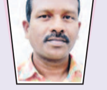
మాచేతికి బెల్లం పెట్టిస్తా? పండ్ల సంది సాంధ్యాల మీదనే ఎల్లడొత్తన్నం. పెద్దసారు కేసీఆర్ దయవల్ల బతుకున్న చీరలు ఇచ్చి మాకు పని కల్పించింది. ఒక్కటారా.. ఎన్నో పథకాలు పెట్టింది. యరల్ సబ్సిడీ, పింఛన్లు ఇచ్చింది. ఆర్టికెల్ల చేతనిండా పనితో నేలకు ₹20వేలు హారవ్వేలా చేసినాం. బార్నా పిల్లలతో ఉన్న ఊళ్ళో బతికినోళ్లం. కాంగ్రెస్ అభినందన గింజ పన్నెత్తడమనే అశ్చర్యం. కానీ, మాచేతికి బెల్లం పెట్టిస్తా? అంతే తప్ప పెద్దగా చేసినదేమీ లేదు.