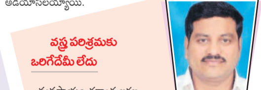
వస్త్ర పరిశ్రమకు ఒరిగేదేమీ లేదు వ్యవసాయం తర్వాత లక్షల మందికి జీవోపోవడం కల్పించేది వస్త్ర పరిశ్రమ. ఆలాంటి బడ్జెట్లో కేటాయింపడం అన్యాయం. కొద్ది నిధుల వల్ల పరిశ్రమకు ఒరిగేదేమీ లేదు. ప్రభుత్వం నేతనల్లను విస్మయపరుస్తూ మానంది, నేతనల్లకు రుణమాఫీ, విద్యార్థులకు స్కూటీలు, నిరుద్యోగ భృతి, తులం బంగారం, ఆలో డైవర్లకు భృతి ఏవైంది? నేతనల్లకు ఉపాధి కల్పించి, వస్త్ర పరిశ్రమను ఆదుకోవాలని బాధ్యత సర్కారుదే.