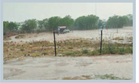
తాండూర్: కురుస్తున్న వర్షం