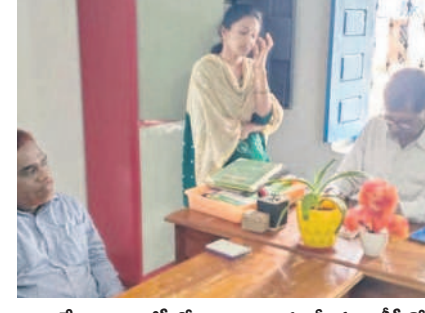
దేవునిగూడ జీవోల రివ్యూలను పరిశీలిస్తున్న డిఎల్ఎస్

జన్మారం, మార్చి 21 : మండలంలోని జన్మారం, దేవుని గూడ గ్రామ పంచాయతీలను శుక్రవారం మంచుర్యాల డిఎల్ఎస్ వెంకటేశ్వర్లరావు సందర్శించారు. ఆయా పంచాయతీల్లో చేడప దుతున్న పారిశుధ్య సమస్యలు, పంచాయతీ కార్యక్రమాల పరిశీలించారు. వేసవి దృష్ట్యా గ్రామాల్లో తాగునీటి ఇబ్బందులు పరిశీలించారు. గ్రామాలు, వివిధ కాలనీల్లో ప్రజలకు ఇబ్బందులు కలిగినా సహాయం చేయాలని అధికారులను ఆహ్వానించారు. అప్రమత్తంగా ఉంటూ సమస్యలను ఎదుర్కోవడం పరిష్కరించాలని సూచించారు.