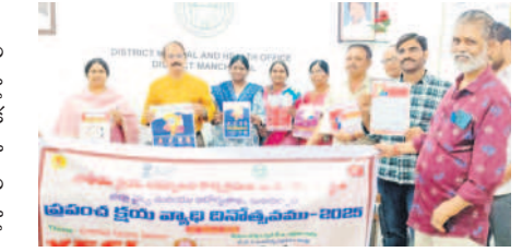
గోడవల్లలను విడుదల చేస్తున్న డిఎంహెచ్ఎస్