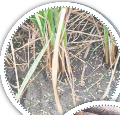
లక్షణపేట: నేలాలిన వడ్లు