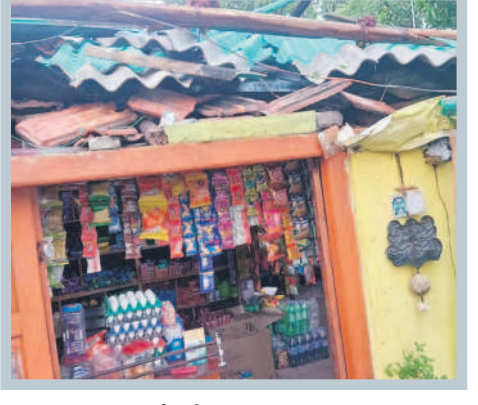
రెవెన్యూ: గోలేటిలో గాలికి ద్వంద్వమైన కిరాణిం