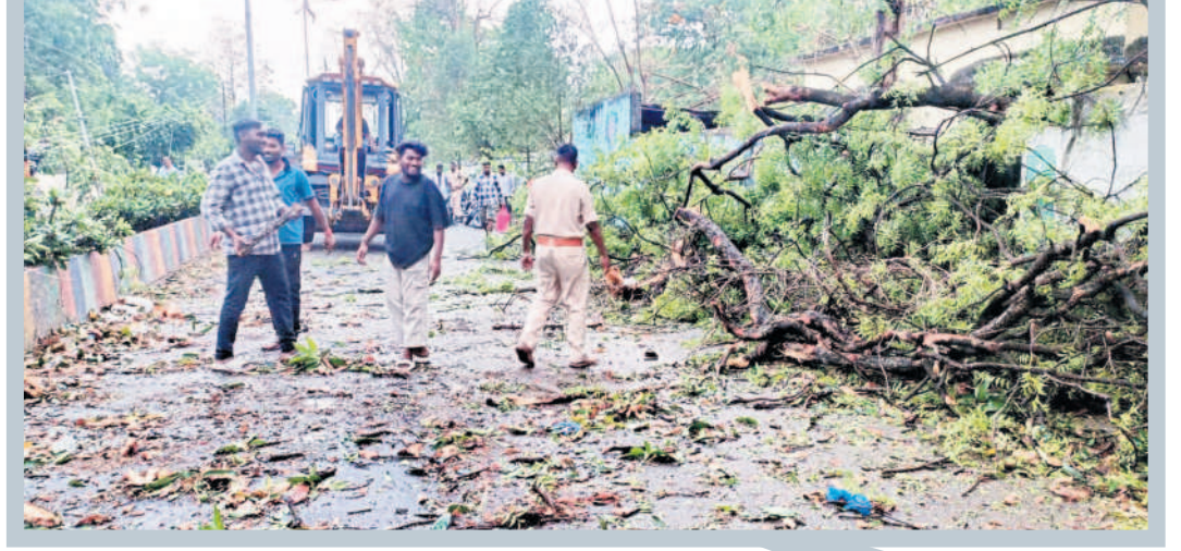
కాగజేనగర్: ప్రధాన రోడ్లపై చెట్ల కొమ్మలను తొలగిస్తున్న పోలీసులు, మున్సిపల్ అధికారులు