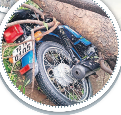
రెవెన్యూ: వాహనంపై పడిన చెట్టు