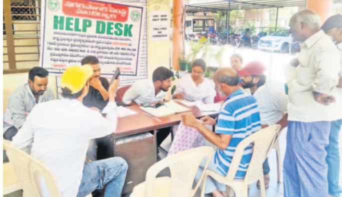
మంచుర్యాలలో ఎల్ఆర్ఎస్ దరఖాస్తు దారుల కోసం ఏర్పాటుచేసిన హెల్ప్ డెస్క్

మంచుర్యాలలోనూ, మార్చి 21 : తేలవల్ల రెగ్యులరైజేషన్ స్కీం 2020 కింద దరఖాస్తు చేసుకున్న వారికి ఫీజులతో 25 శాతం రాయితీని కలిగిస్తూ ప్రభుత్వం నిర్ణయం తీసుకున్నది. అయితే కఠిన ప్రదేశాల నిబంధనల మూలంగా ఈ అవకాశాన్ని దరఖాస్తుదారులు పూర్తిస్థాయిలో సద్వినియోగం చేసుకోలేక పోతున్నారు. 2020 సంవత్సరంలో రూ. 1000 చెల్లిం పల్ ఎల్ఆర్ఎస్ కోసం దరఖాస్తు చేసుకున్న వారందరితో ఫీజు చెల్లించుకుని వారికి ఎల్ఆర్ఎస్ ప్రాసెసింగ్ లు అందించాలని ప్రభుత్వం నిర్ణయం తీసుకున్నది. కానీ, ఫ్యాట్ల కోసం గాలు చేసిన వారు దరఖాస్తు చేసుకున్న తర్వాత ప్రాథమిక దశలో మున్సిపల్ టౌన్షిప్ సింగిల్ అధికారులు విచారణ జరిపి ఆ ఫ్యాటు సరైనదేనా? కాదా? అన్న విషయానికి నిర్ణయించుకుని, సంబంధిత ఫూమ్ పత్రాల