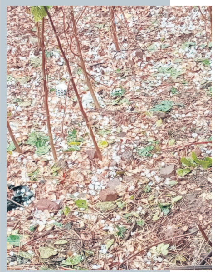
దండేపల్లి: గూడెంలో కురిసిన వడగండ్లు