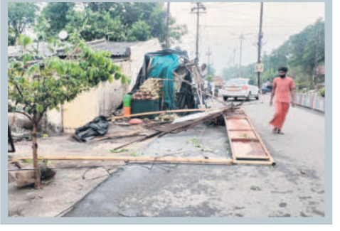
కాగజేనగర్: కూలిన బోర్డు, తాత్కాలిక షెడ్లు