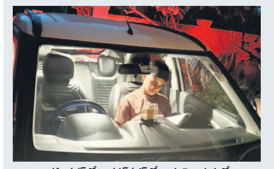
కరీంనగర్లోని భగత్ నగర్లో కాదు వెలుతురులో చదువుతున్న పదో తరగతి విద్యార్థి