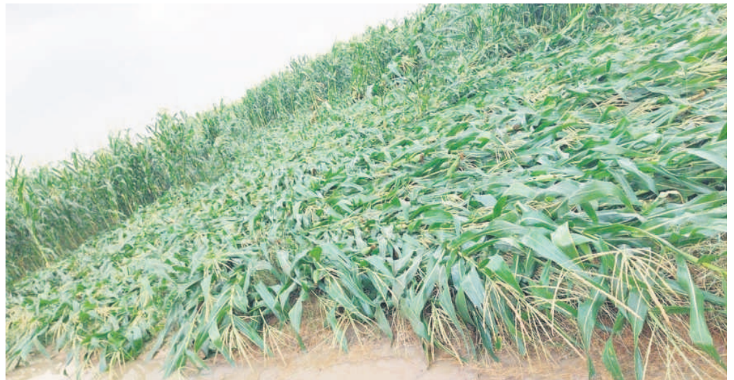
చొప్పదండి: అకాల వర్షానికి నేలవాలిన మక్క వేస

పంటలు చేతికొచ్చిన దశలో అకాల వర్షం ముంచింది. ఉమ్మడి కరీంనగర్ జిల్లాలో శుక్రవారం అకాల వాన దంబికొట్టింది. సాయంత్రం భారీగా గాలులు వీస్తూ ఉరుములు మెరుపులతో కురిసింది. అక్కడక్కడా రాళ్ల వాన పడింది. దీంతో చేతికొచ్చిన వరి, మక్క పంటలతోపాటు మామిడి తోటలకు తీరని నష్టం వాటిల్లింది. అసలే సాగునీరు లేక అక్కడక్కడా పడుతున్న రైతలపై ఈ వాన మరింత ప్రభావం చూపింది.