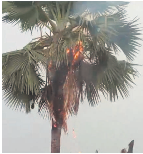
కొడిమ్యాల: పిడుగుపాటుతో కాలిపోతున్న తాటివెట్లు