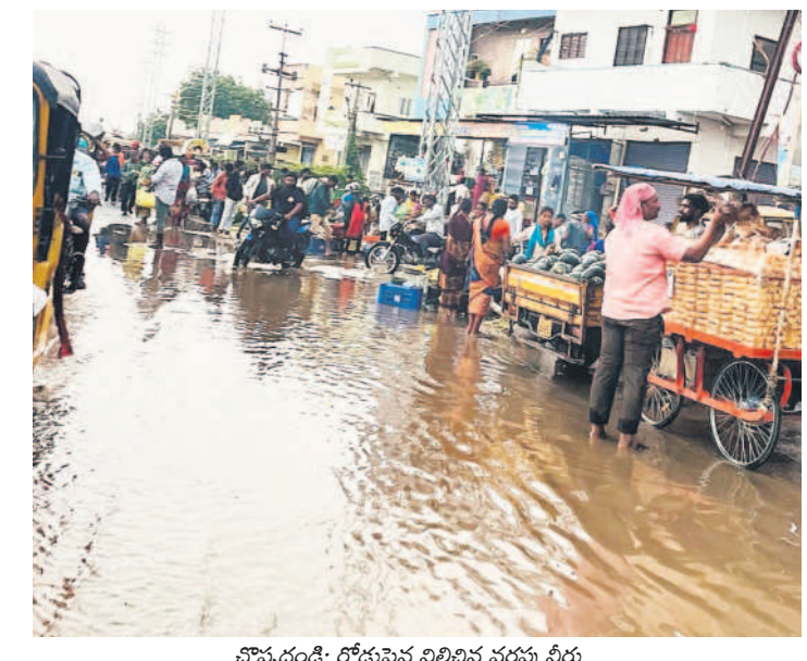
చొప్పదండి: రోడ్డునీరు నిలిచిన వర్షపు నీరు