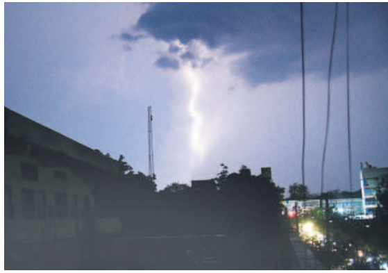
కరీంనగర్: ఆకాశంలో మెరుపులు