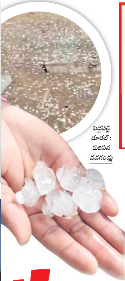
పెద్దపల్లి రూరల్: కురిసిన వడగండ్లు