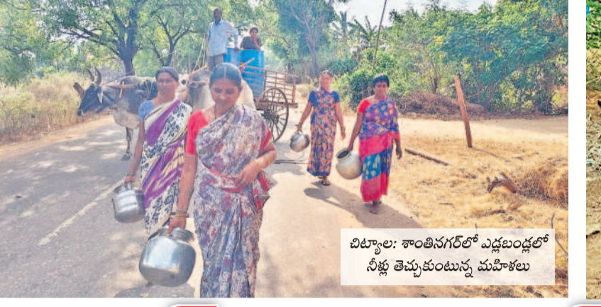
చిట్టాల: శాంతినగర్ లో ఎడ్లబండ్లలో నీళ్లు తెచ్చుకుంటున్న మహిళలు

మారుమూల పల్లెలు, తండాల్లో తాగునీటి తండ్రాట మొదలైంది. ఎప్పుడూ లేని విధంగా మహిళలు బండెలతో రోడ్లపైకి రావాల్సిన దుస్థితి వచ్చింది. భూగర్భ జలాలు అడుగుంటుండ, సరిపాతా తాగునీటి సరఫరా లేక వ్యవసాయ బావులలో పాటు నిల్వ అక్కడయి అక్కడికి పరుగులు తీస్తున్నారు. చాలాచోట్ల ధారలా వచ్చే కొద్దిపాటి నీటి కోసం పోటీపడుతుండగా, మరికొన్ని చోట్ల రాత్రినకా, పగలనకా ఎడ్లబండ్లపై ప్రముఖ్ నీరు తెచ్చుకుంటున్నారు. పదిల్లుగా 'మిషన్ భగీరథ' ద్వారా ఇంటి వద్దనే తాగునీరు వస్తుండగా కొద్దిరోజుల నుంచి అధికారుల నిర్లక్ష్యం వల్ల అందరికీ నీళ్లందక ఇబ్బందులు పడుతున్నామని గ్రామస్థులు ఆందోళన చెందుతున్నారు. ఇప్పటికైనా శాశ్వత పరిష్కారం చూపి నీటి గోస తీర్చాలని కోరుతున్నారు.