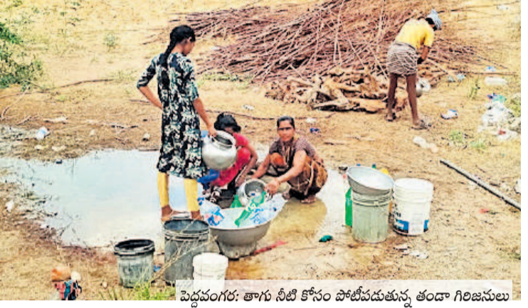
పెద్దవంగర: తాగు నీటి కోసం పోటీపడుతున్న తండా గిరిజనులు