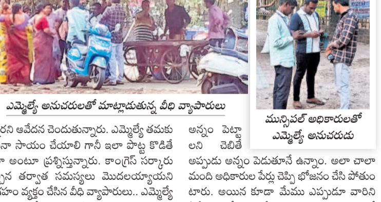
మొట్టమొదటి అధికారులతో ఎమ్మెల్యే అనుచరుడు

సంఘానగర్, మార్చి 21: వీధి వ్యాపారులపై వరంగల్ పశ్చిమ ఎమ్మెల్యే అనుచరుల ప్రతాపం చూపారు. 20 ఏళ్లగా పట్టి గార్డెస్ వద్ద భోజన వ్యాపారం చేసుకుంటూ బతుకేడుస్తున్న చిరు వ్యాపారులపై సరదా వ్యక్తులు దురాచారాలు పెట్టుకుంటారు, వాళ్లను ఏమీ అనకండి, వారు కూడా ఇక్కడే ఉంటారు.. ఒకవేళ సహకరించకపోతే మున్సిపాలిటీ వారు మీ పాపులను తొలగిస్తారు.. మేం చెప్పినట్లుగా వివాదాల్లోనే బిడియింట్ల నట్లు సమాచారం. చిరువ్యాపారులు నడుపుకొంటున్న చిన్నపిల్లల పాపం వ్యక్తులు అనుచరులకు పట్టించుకోవడం లేదు. శాంతినగర్ లో లీకేజీ, గేటు వారీ సమస్య, ఎత్తు, వచ్చులు అంటూ కారణాలు చెబుతూ దాడిస్తున్నారు. వెంటనే ఉన్నతాధికారులు శాంతినగర్ లో నీటి సమస్య రాకుండా శాశ్వత పరిష్కారం చూపాలి. లేకపోతే అనే ఎడ్లబండ్లతో, బండెలతో రోడ్డు మీద నిరసనలు తెలుపుతాం..