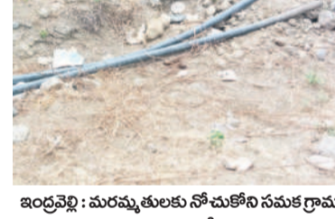
ఇంద్రవెల్లి : మరమ్మత్తులకు సోచుకోని సమక గ్రామ సేవార్యులను మిషన్ భగీరథ పైపైలైన్

ఇంద్రవెల్లి, మార్చి 21 : ఇంద్రవెల్లి మండలంలోని సమక గ్రామపంచాయతీ పరిధిలోని పాటగూడకు చెందిన కొలాం ఆదివాసి గిరిజనులు బిందెలు నీటి కోసం కిలోమీటర్ల సదావార్లు వస్తున్నారు. సమక గ్రామపంచాయతీ పరిధిలోని పాటగూడలో