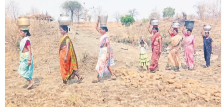
పాటగూడలో ఇందిలతో నీటిని మోసుకొస్తున్న కొలాం ఆదివాసి మహిళలు

63 ఉమ్మడి కుటుంబాలు ఉండగా 450 మంది జనాభా ఉంది. తాగునీటి కోసం గతంలో అధికారులు ఓ వ్యవసాయ భూమిలో బోరుబావి తో పాటు రెండు చేతి బావులను ఏర్పాటు చేశారు. ఎండల తీవ్రతకు బోర్లు, చేతిబావులు అడుగంటిపోయాయి. మిషన్ భగీరథ పథకం పైపైలైన్ మధ్యలోనే పగలిపోవడంతో నీటి సరఫరా నిలిచిపోయింది. కొన్ని రోజులూ తాగునీటికి కొలాం ఆదివాసి గిరిజనులు తీవ్ర ఇబ్బందులు పడుతున్నారు. ఉదయం, సాయంత్రం గ్రామస్థులు సమీపంలోని వ్యవసాయ బావులకు వెళ్లి నీటిని బిందెలు, క్యాప్సల్ మోసుకువస్తున్నారు. ఆ బావిలోకి దిగి బిందెలు నీళ్లు తెచ్చేందుకు అనేక కష్టాలు పడుతున్నామని అవేదన వ్యక్తం చేశారు. నీటి ఎడ్లబండ్ల గ్రామాల్లో పెళ్లి వేడుకలు నిర్వహించాలంటే భయంగా ఉందని అవేదన వ్యక్తం చేస్తున్నారు. ఇప్పటికైనా అధికారులు స్పందించి మిషన్ భగీరథ పైపైలైన్ మరమ్మత్తులు చేసి ప్రతి రోజూ తాగునీటిని సరఫరా చేయాలని కోరుతున్నారు.