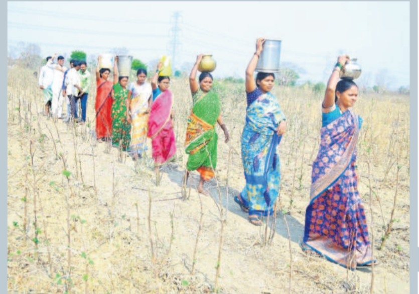
ఆదిలాబాద్ రూరల్ మండలం చిట్టాలబోలలో వ్యవసాయబావి నుంచి నీటిని తెచ్చుకుంటున్న గిరిజనులు