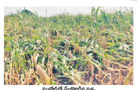
ముఖ్యోద్యోగి నేలకొరిగిన మక్క