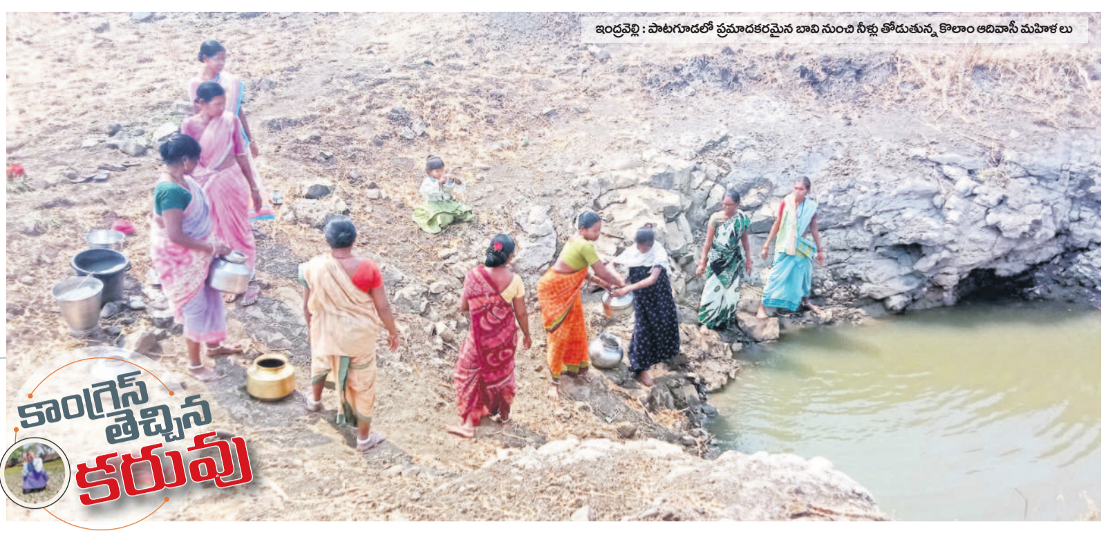
ఇంద్రవెల్లి : పాటగూడలో ప్రమాదకరమైన బావి నుంచి నీళ్లు తోడుతున్న కొలాం ఆదివాసి మహిళలు