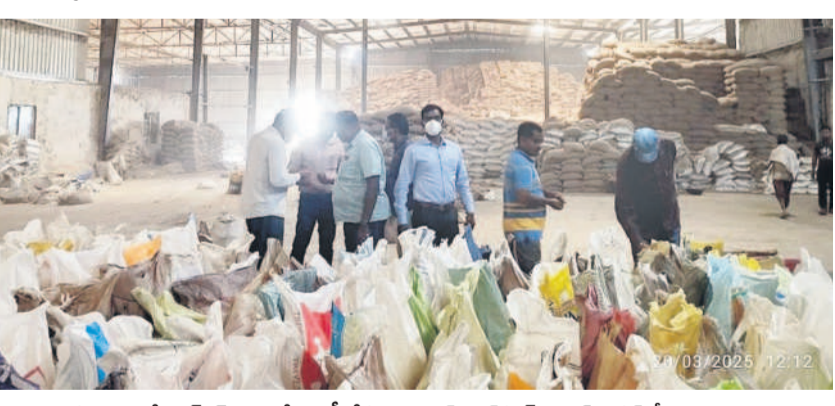
సత్తనపల్లిలో ఏఆర్ఎన్ మిల్లులో తనిఖీ చేస్తున్న విజిలెన్స్, ఎన్ఫోర్స్ మెంట్ స్పెషల్ టీం అధికారులు

ఖానాపూర్ రూరల్, మార్చి 21: నిర్మల్ జిల్లాలోని ఖానాపూర్ మండలంలో సత్తనపల్లిలో అధికార పార్టీ నాయకుడికి చెందిన రైస్ మిల్లులపై విజిలెన్స్ ఎన్ఫోర్స్ మెంట్ అధికారులతో పాటు స్పెషల్ టాస్క్ ఫోర్స్ బృందం ఆన్సర్లలో తనిఖీలు చేశారు. గురువారం ఉదయం 11 గంటల నుంచి సాయంత్రం 4 గంటల వరకు తనిఖీలు చేశారు. ఇందుకు సంబంధించిన వివరాలను శుక్రవారం అధికారులు వెల్లడించారు. ఈ తనిఖీల్లో 12,202.203 మెట్రిక్ టన్నుల వరి దాన్లుంటే తేడాగా ఉన్నట్లు అధికారులు గుర్తించారు. దీని విలువ సుమారు రూ.26 కోట్ల వరకు ఉంటుందన్నారు. ఏఆర్ ఎన్ ఇండస్ట్రీయల్ మిల్లులో రబీ సీజన్ 2022-2023-