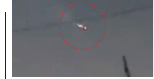
జంబిగడ్డలో చక్కడ్లు కొడుతున్న డ్రోన్