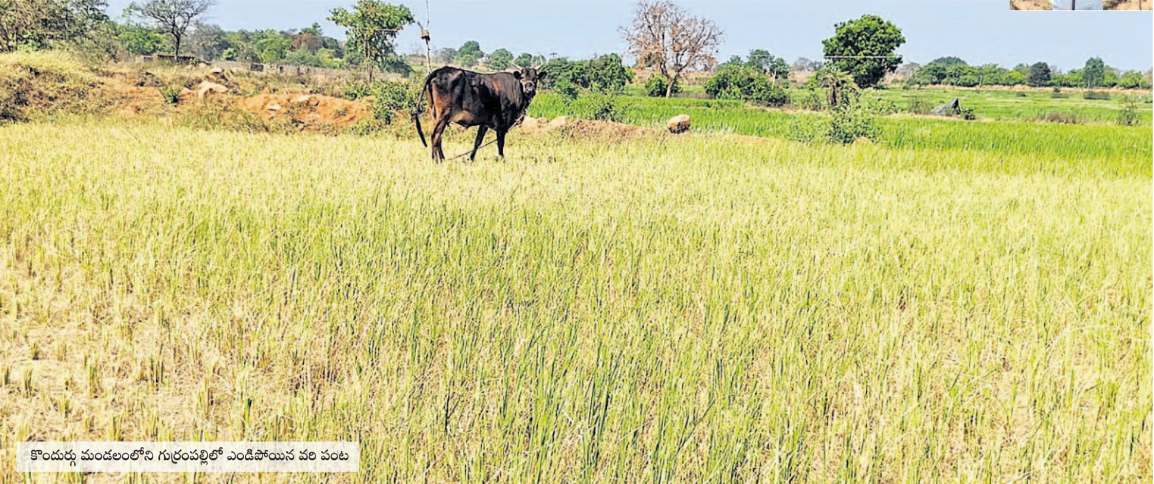
కొండుర్ల మండలంలోని గుర్రంపల్లిలో ఎండిపోయిన పంట