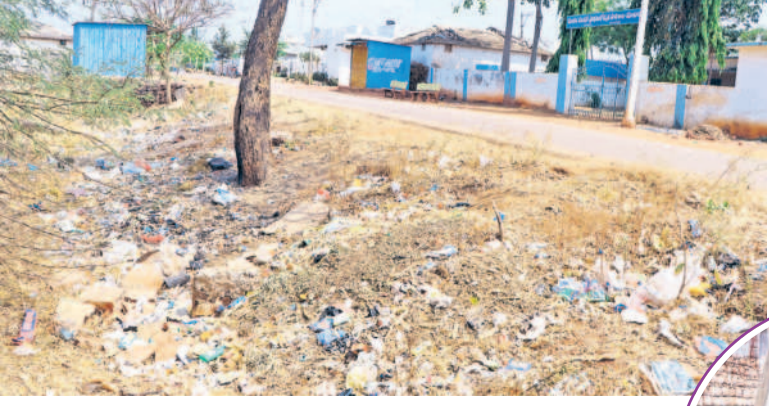
నవాపేట మండలం మాదారం గ్రామంలో ఎక్కికర్షణ పేరుకుపోయిన చెత్తాచెదారం

వడంతో అభివృద్ధి కుంటుపడుతున్నది. గ్రామాలను పరిశుభ్రంగా ఉంచే పంచాయతీ కార్యకర్తలకు ఏదైనా మిడి నెలలుగా తీతాలు చెల్లించకపోవడంతో తీవ్ర ఇబ్బందులకు గురవుతున్నారు. వారు పారిశుధ్య నిర్వహణపై శ్రద్ధ చూపక పోవడంతో ఎక్కడ చూసినా మురుగునీటి ప్రవాహం, చెత్తాచెదారమే దర్శనమిస్తున్నది. అదేవిధంగా కనీసం డ్రైనేజీ పైపు లైన్లకు మరమ్మత్తులు చేయలేని దుస్థితి నెలకొనడంతో గ్రామ పంచాయతీ పనిచేయలేదు. తీవ్ర పరిస్థితి నెలకొన్నది. గతేడాది వేసవిలో తాగు నీటి సమస్యను పరిష్కరించేందుకు చేసిన మరమ్మత్తులకు సంబంధించిన నిధులను ప్రభుత్వం ఇప్పటికీ చెల్లించలేదు.