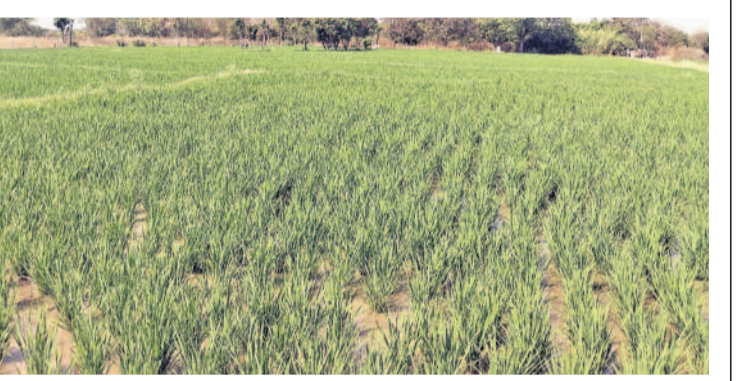
లేమామిడి శివారంలో సాటి రైతు సాయంతో కాపాడుకుంటున్న పంట