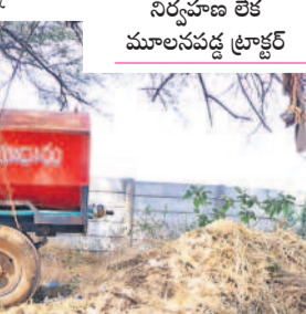
లేదు. ఆ మొత్తం దాదాపుగా రూ. నాలుగు కోట్ల వరకు ఉన్నది.