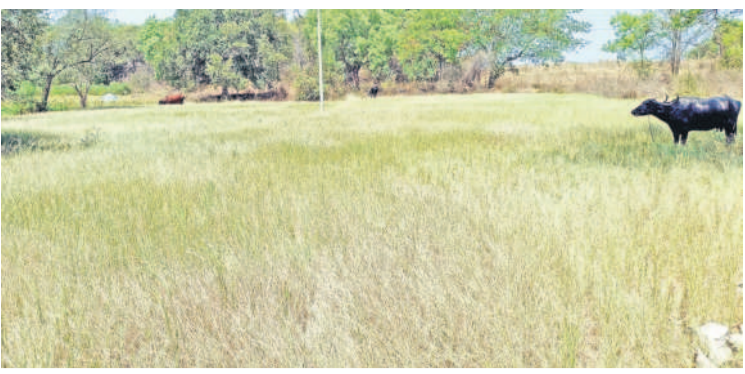
తాండూరు : యాలాల మండలంలోని గిరిజాపూర్ లో నీళ్లు లేక ఎండిన పంట చేసు