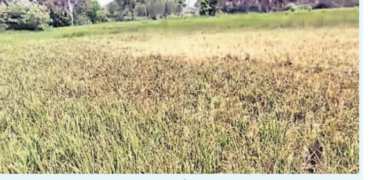
సుల్తాన్ పూర్ గ్రామంలో ఎండిన పంట