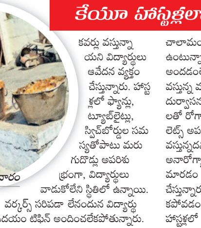
కాకతీయ యూనివర్సిటీలోని కామన్ మెన్ భోజనం

కాకతీయ యూనివర్సిటీలో హాస్టల్లో సమస్యలు తీవ్రమైనాయి. అలాగే గడుచాలా అసౌకర్యాలను విద్యార్థులు అనుభవిస్తున్నారు. సుదూర ప్రాంతాల నుంచి వచ్చి హాస్టల్లో ఉంటున్న విద్యార్థులకు నాణ్యమైన భోజనం కరువైంది. వెయ్యి మంది విద్యార్థులకు ఉపయోగపడే కామన్ మెన్ లో నాణ్యత లోపించడంతో విద్యార్థులు ఆందోళనకు దిగాల్సిన పరిస్థితి దాపురించింది. కామన్ మెన్ భోజనంలో నాణ్యత లేదని, పురుగులు, ప్లాస్టిక్ లకు ఉదయం టిఫిన్ అందించలేకపోతున్నారని.