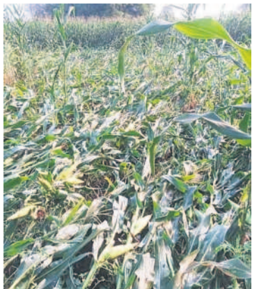
వర్మతగిరి: బింతకొండలో మక్కజొన్న చేనులో నీటిని ఎత్తిపోస్తున్న రైతులు