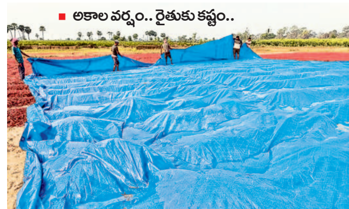
మంగపేట: కల్లంలో ఆరబోసిన మిర్చి తడవకుండా టార్పాలిన్ షీట్లపైకి చేరిన వాన నీటిని ఎత్తిపోస్తున్న రైతులు