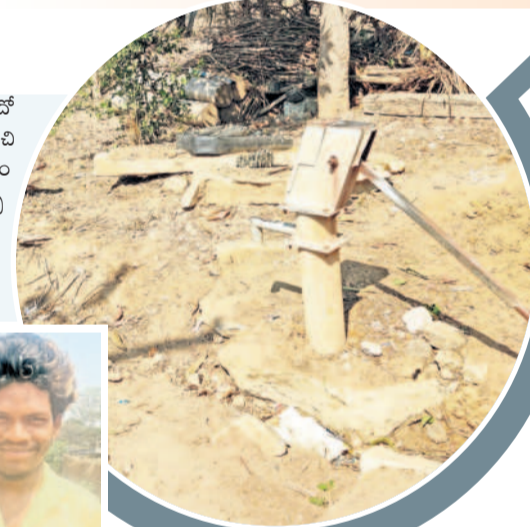
నీరు రాని వేతివంపు

చంద్రకుంట గ్రామంలో తీవ్రంగా తాగునీటి ఎద్దడి • 18 కుటుంబాలకూ సక్రమంగా అందని తాగునీరు • స్నానం చేసేందుకూ వెనుకాడుతున్న డైన్యంలో వృద్ధులు • 'మిషన్ భగీరథ' లోతులపై దృష్టి పెట్టని కాంగ్రెస్ పాలకులు • సరిపడా నీళ్లువ్వలేకపోతున్న సింగరేణి సోలార్ బోరు పైపులు • చంద్రకుంట, పాతూరుల్లో వేసే ప్రారంభంలోనే నీటి కటకట