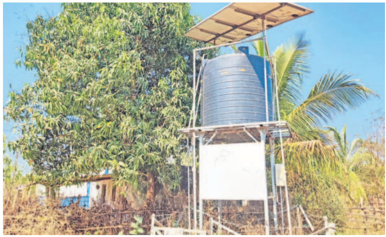
చంద్రకుంట గ్రామంలో సింగరేణి అధికారులు వేసిన సోలార్ బోరు సిస్టమ్

భద్రాద్రి కొత్తగూడెం, మార్చి 22 (నమస్తే తెలంగాణ) : అది జిల్లా కేంద్రానికి దగ్గరలో ఉన్న గ్రామం. 18 కుటుంబాలు 55 మంది జనాభా ఉన్న ఓ చిన్న గ్రామం. అదే.. చుంచుపల్లి మండలం వెనక డబ్బు పంచాయతీలోని చంద్రకుంట. ఇంత చిన్న గ్రామాన్ని తాగునీటి సమస్య మాత్రం వెంటాడుతోంది. మరోవైపు గత కేసీఆర్ ప్రభుత్వం తెచ్చిన మిషన్ భగీరథ పథకాన్ని ప్రస్తుత కాంగ్రెస్ ప్రభుత్వం పట్టించుకోకపోవడం కూడా ఈ గ్రామ ప్రజలకు శాపంగా మారింది. భగీరథ పథకం లోతులు ఉన్నా కనీసం మరమ్మతులు చేసిన పాపానపో లేదు. దీంతో గ్రామానికి పెద్దగా నీరు రావడం లేదు. ఆ నీళ్ళే ఒక్కో బింది నిండేందుకు అరగంట పడుతోందంటే అతిశయోక్తి కాదు. మరోవైపు ఇదే గ్రామానికి నీళ్లు అందించేందుకు సింగరేణి ఏర్పాటు చేసిన సోలార్ బోరు పైపులైన్ పరిస్థితి కూడా అలాగే ఉంది. కనీసం దాని నుంచి నీళ్లు కూడా సరళా కావడం లేదు. నీటి సమస్య కారణంగా వ్యవస్థాపన చేసేందుకు కూడా వెనుకాడుతున్నారంటే ఆ గ్రామంలో నీటి సమస్య ఎంత తీవ్రంగా ఉందో అర్థం చేసుకోవచ్చు. వేసే ప్రాంతంలోనే భద్రాద్రి జిల్లాను తాగునీటి సమస్య పట్టి పీడిస్తోంది. తాగునీటి సమస్యను సమూలంగా నిర్మూలించాలని, ఇంటింటికీ శుద్ధ జలాలు అందించాలని గత కేసీఆర్ ప్రభుత్వం తీసుకున్న చర్యలు ఎంతో మంచి ఫలితాలనిచ్చాయి. మిషన్ భగీరథ పథకం ద్వారా ఇంటింటికీ శుద్ధ జలాలు అందాయి. కానీ, ఏడాది సగ్గర క్రితం వచ్చిన కాంగ్రెస్ సర్కారు మిషన్ భగీరథ పథకాన్ని నీరు గారుస్తోంది. కనీసం మరమ్మతులపై కూడా దృష్టిసారించడం లేదు. దీంతో ఆవాస గ్రామాలకు తాగునీరు అందని ద్రాక్షగానే మిగులుతోంది. భద్రాద్రి జిల్లాలో 481 గ్రామ పంచాయతీలుండగా..