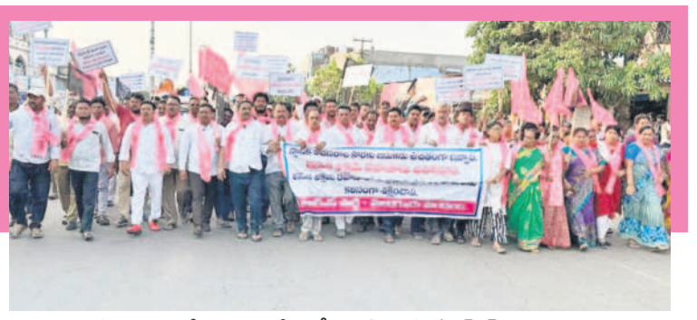
మణుగూరులో షకార్లలతో ర్యాలీ నిర్వహిస్తున్న బీఆర్ఎస్ నాయకులు

మండల కేంద్రాల్లో తాగునీటి ఎద్దడి ఇలా ఉంటే.. ఆవాస ప్రాంతాల్లో అయితే తాగునీళ్లు అందని ద్రాక్షగానే మారాయి. మరమ్మతులకు గురైన వేతివంపులు అలంకారప్రాయాంగా కనిపిస్తుండడం సమస్యకు అడ్డంపడుతోంది. లక్ష్మీదేవిపల్లి మండలం పాతూరు గ్రామంలో నీటి సమస్య అక్కడి ప్రజలను ఇబ్బంది పెడుతోంది. గుండాల మండలం బాబున్నగర్, ఆళ్లపల్లి మండలం అవడిరామవరం, టేకులపల్లి మండలం మంగళతండా, సుజాతనగర్ మండలం కేంద్రంలోని బాలాజీ నగర్ తోపాటు ములకలపల్లి మండలంలోని మరో రెండు గ్రామాల్లో వేసిన నల్లాలకు ప్రస్తుత కాంగ్రెస్ పాలకులు కనీసం నీటిని కూడా సరళా చేయడం లేదు. దుమ్ముగూడెం మండలం ఎర్రబోరులో గ్రామస్థులకు ట్యాంకు నుంచి నీళ్లు అందని పరిస్థితి ఏర్పడింది. అయితే వేసే ప్రాంతంలోనే తాగునీటి సమస్య ఇంత తీవ్రంగా ఉంటే.. మందు వేసేవెలో ఎలా ఉంటుందోనని ఆయా గ్రామాల ప్రజలు అదోక్షన వ్యక్తం చేస్తున్నారు.