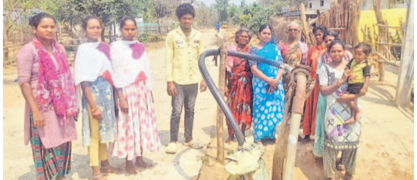
లక్ష్మీదేవిపల్లి : నీళ్లు రాని బోరు వద్ద గ్రామస్థులు

63 కుటుంబాలు.. రెండు వంపులు.. లక్ష్మీదేవిపల్లి, మార్చి 22 : లక్ష్మీదేవిపల్లి మండలం మైలారం పంచాయతీ పాతూరులో తాగునీటి ఎద్దడి తీవ్రంగా ఉంది. ఈ గ్రామంలో 63 కుటుంబాలు నీరు సస్యిస్తాయి. వీటి కోసం ఒక విద్యుత్ బోరు, ఒక చేతి పంపు ఉన్నాయి. అయితే కాంగ్రెస్ ప్రభుత్వం వచ్చినప్పటి నుంచి కరెంట్ ఎప్పుడూ ఉంటుందో, ఎప్పుడూ పోతుందో తెలియడం లేదు. కరెంట్లు ఉన్నప్పుడే బోరు నుంచి ఉడయం ఒక గంట సేపు నీళ్లు ఇస్తారు. సాయంత్రం మరో అరగంట ఇస్తారు. ఇంతకొద్దీ సమయంలో ఇచ్చే నీళ్లు గ్రామస్థులకు సరిపోవడం లేదు. ఒకవేళ కరెంట్లు లేకపోతే ఆ నీళ్లు కూడా రానట్టే. ప్రత్యామ్నాయంగా ఉన్న వేతివంపు నుంచి కూడా నీళ్లు రావడం లేదు.