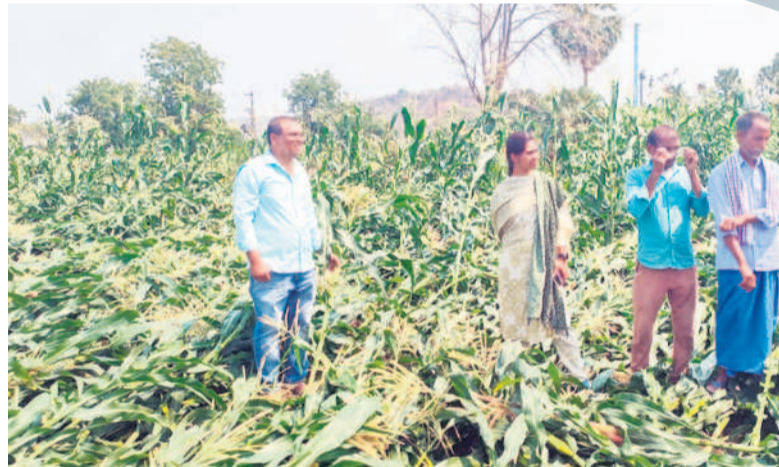
జనవారి : మొలకలలో నేలవాని మక్క పంటను పరిశీలించు అధికారులు