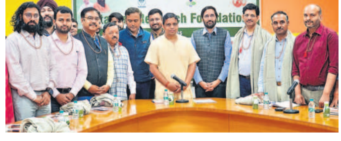
కేఎల్ హెచ్ బాచుపల్లి క్యాంపస్ లో కళా ఉత్సవం

సీటీ బ్యూరో, మార్చి 22 (నమస్తె తెలంగాణ) : దేశంలోని గ్రామాల అభివృద్ధిలో నాబార్డ్ కీలక పాత్ర పోషిస్తుందని పతంజలి అధినేత ఆచార్య బాలకృష్ణ అన్నారు. పతంజలి రిసెర్చ్ ఫౌండేషన్ అధ్యక్షులతో ఒకరోజు నాబార్డ్ సందర్భం కార్యక్రమాన్ని ఉత్తరాఖండ్ లోని హరిద్వార్ లో శనివారం నిర్వహించారు. గ్రామీణ ప్రాంతాల్లో నాబార్డ్ సహకారంతో జరిగిన అభివృద్ధి కార్యక్రమాల గురించి తెలుసుకోవడం ఉద్దేశంగా ఈ కార్యక్రమం జరిగింది. నాబార్డ్ అధ్యక్షులతో కేంద్రం చేపట్టిన పథకాలను పతంజలి ప్రతినిధులకు వివరించారు.