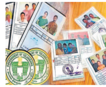
జారీ చేస్తామని చెప్పడం చూస్తుంటే కావాలనే రేషన్ కార్డుల జారీలో కాలయాపన చేస్తున్నట్లు ఆరోపణలు వస్తున్నాయి. రేషన్ కార్డుల కోసం దరఖాస్తుదారులు ప్రజాప్రతినిధుల, అధికారులను మట్లాడుతున్నారని జారీలో లబ్ధిదారుల ఎంపికల్ని విచారణ జరుగుతుందని విచారణ అనంతరం రేషన్ కార్డులు

మేడ్చల్, మార్చి 22 (నమస్తె తెలంగాణ) : రేషన్ కార్డుల జారీలో విచారణ పేరిట జాప్యం చేస్తున్నట్లు దరఖాస్తుదారుల నుంచి ఆరోపణలు వినిపిస్తున్నాయి. రేషన్ కార్డుల కోసం దరఖాస్తుదారులు ఎదురుచూపులు తప్పడం లేదు. జనవరి 28 న ఆరు పథకాల కార్డులను జారీ చేసిన విషయం విధితమే. అలాగే నుంచి ఇప్పటి వరకు రేషన్ కార్డుల జారీలో లబ్ధిదారుల ఎంపికల్ని విచారణ జరుగుతుందని విచారణ అనంతరం రేషన్ కార్డులు