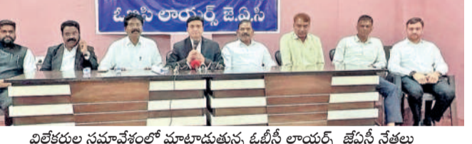
విలేజరుల సమావేశంలో మాట్లాడుతున్న ఓటిని రాయర్స్ జేపీసీ నేతలు