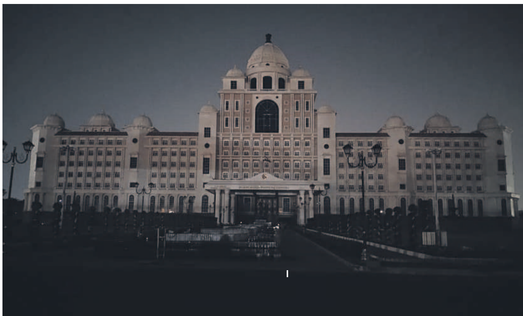
ఎన్టీఆర్ దే సందర్భంగా బీకట్లో సచివాలయం