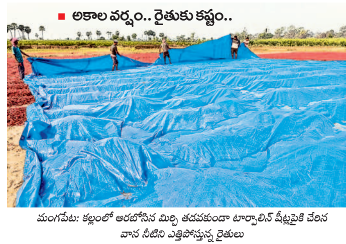
మంగపేట: కల్లంలో ఆరబోసిన మిల్లి తడవకుండా టార్పాలిన్ షీట్లపైకి చేరిన వాన నీటిని ఎత్తిపోస్తున్న రైతులు

పంటలు చేతికొచ్చే వేళ అకాల వర్షం రైతులను అగం చేస్తున్నది. శుక్రవారం రాత్రి, శనివారం తెల్లవారుజామున కురిసిన వానకు పలుచోట్ల వరి నేలవాలగా కల్లాల్లో ఆరబోసిన మిల్లి తడినిపోతున్నది. ఇప్పటికే గిట్టుబాటు ధర లోక అధికారంలో ఉన్న మిల్లి రైతుకు ప్రకృతి వగబట్టినట్లు పరిశ్రమ పెరుతున్నది. వాతావరణం చల్లబడటం, మలకొన్ని రోజులు వర్షాలు వడే సూచనల నేపథ్యంలో టార్పాలిన్లు, పరదాలు కప్పతూ పంటలను కాపాడుకోవాల్సి వస్తున్నది. భూపాలపల్లి, ములుగు జిల్లాల్లోని కాటారం, టేకుమట్ల, వాజేడు, మంగపేట, వరంగల్ జిల్లాల్లోని వర్షాతగిరి మండలాల్లో శనివారం సాయంత్రం కురిసిన వర్షానికి వరి, మక్కజొన్న పంటలు నేలవాలాయి. - నమస్తే నేటివర్య, మార్చి 22