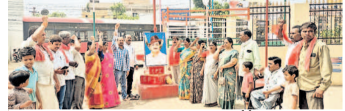
భగత్ సింగ్ చిత్రపటానికి పూలమాల వేసి నివాళులర్పిస్తున్న సీపీఐ నాయకులు