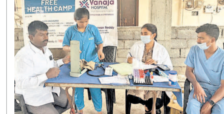
దమ్యాయిగూడ 8వ వార్డు శ్రీ వేదాద్రినగర్లో నిర్వహించిన ఉచిత వైద్య శిబిరంలో వైద్య పరీక్షలు నిర్వహిస్తున్న వనజ దవాఖాన వైద్యులు