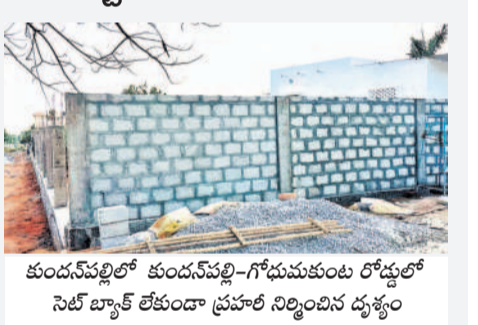
కుండ్లపల్లిలో కుండనపల్లి-గోడుమకుంట రోడ్డులో సెల్ బ్యాక్ లేకుండా ప్రసార నిర్మాణం చేస్తున్న దృశ్యం

మేడ్చల్ కలెక్టరేట్, మార్చి 23: అధికారుల పర్యవేక్షణ లేక, లంచాలకు అలవాటు పడడంతో అక్రమ నిర్మాణాలు జోరుగా జరుగుతున్నాయి. దమ్యాయిగూడ మున్సిపాలిటీ కుండనపల్లి గ్రామంలో కుండనపల్లి సుండ్ గోడుమకుంటకు వెళ్లే ప్రధాన రహదారి అనుకొని ఎలాంటి అనుమతులు తీసుకోకుండా అక్రమ నిర్మాణాలు చేపడుతున్నారు. అక్రమ నిర్మాణాలే కాక, ఎలాంటి సెల్ బ్యాక్ లేకుండానే బీటీ రోడ్డు అనుకొని నిర్మాణాలు చేస్తున్న టౌన్ ప్లానింగ్, మున్సిపల్ అధికారులు అటు వైపు కన్వెట్ చూడడం లేదన్న విమర్శలు వినిపిస్తున్నాయి. రోడ్డుకు అనుకొని నిర్మాణాలు చేస్తే భవనవ్యతిరేక ఇబ్బందులు పడుతాయని గోడుమకుంట గ్రామస్థులు, కుటుంబ వాహనదారులు ఆవేదన వ్యక్తం చేస్తున్నారు. 100 పీజి రోడ్డును అక్రమ నిర్మాణాలు చేపట్టి 50 పీజి రోడ్డుగా మారుస్తున్నారని వాహనదారులు వివాదం వ్యక్తం చేస్తున్నారు. రోడ్డుకు అనుకొని నిర్విస్తృత కట్టడాలను నిలుపుదల చేయాలని, సెల్ బ్యాక్ తీసుకొని నిర్మాణాలు చేపట్టాలని ప్రజలు, వాహనదారులు కోరుతున్నారు.