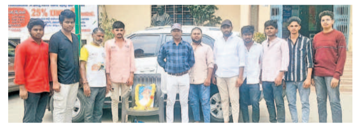
గుండ్లపోచంపల్లి మున్సిపాలిటీలో భగత్ సింగ్ చిత్రపటానికి పూలమాల వేసి నివాళులర్పిస్తున్న ప్రగతిశీల యువజన సంఘం సభ్యులు