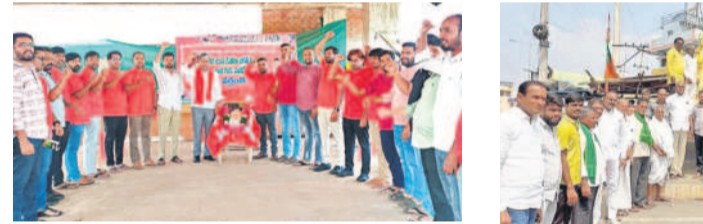
జహీరాబాద్ లో భగత్ సింగ్ పటానికీ పూలమాలలు వేసి నివాళులర్పిస్తున్న సీఎం నాయకులు