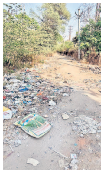
భిల్ లో అపరిశుభ్రంగా మారిన రోడ్డు మార్గం