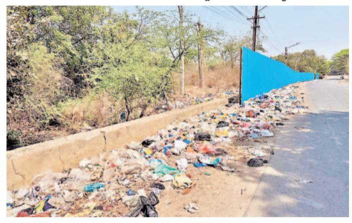
రోడ్డు పక్కన పేరుకుపోయిన చెత్తాచెదారం, ప్లాస్టిక్ కవర్లు

రామచంద్రాపురం, మార్చి 23 : బీహెచ్ ఈఎల్ అంటేనే పచ్చదనం, స్వచ్ఛమైన గాలి, చక్కటి వాతావరణం. ఇలాంటి ప్రకృతి ప్రేమికులు వాతావరణం హైదరాబాద్ దగ్గర్లో మనకు ఎక్కడ దొరకదని చెప్పుకోవచ్చు. ట్రాఫిక్ లో ఉక్కిరిబిక్కిరయ్యే వాహనదారులకు భిల్ పరిసరాల్లోకి రాగానే ఏదో తెలియని ప్రకృతి ప్రేమికులు రామచంద్రాపురం, పటాన్చెరుకు వెళ్లి వారు చందానగర్, లింగంపల్లి వరకు మొయిం నోట్లపై వచ్చి అక్కడి నుంచి బీహెచ్ ఈఎల్ కానీ అధికారుల నిర్లక్ష్యంతో వర్షావరణానికి లోకీ ప్రవేశించి పచ్చటి అందాన్ని, స్వచ్ఛమైన విభూతం కలుగుతుంది. భిల్ లో చెత్త డంపింగ్ యార్డు వాయు కాలుష్యం పెరుగుతుంది.