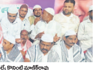
సమావేశంలో మాట్లాడుతున్న దళిత సంఘం నాయకులు

ఖర్జూర్, తిరువనంతపురం లోని కొరింటి మాజీ కార్యదర్శి