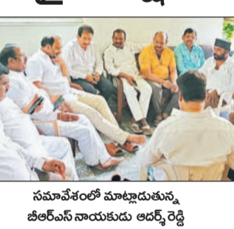
సమావేశంలో మాట్లాడుతున్న జిఆర్ ఎస్ నాయకులు అధ్యక్షులు

రామచంద్రాపురం, మార్చి 23 : రామచంద్రాపురం పట్టణంలోని ఈడాలో ఈనెల 27న ఇష్టానుగుణ్యంగా పండుగలు జరుపుకోవాలి