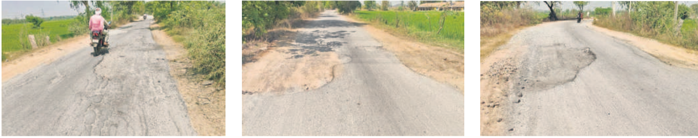
వెల్దుర్తి-మెడక్ ప్రధాన రహదారిపై ఉన్న గోతులు, ఎలాంటి సూచిక బోర్డులు లేకుండా ప్రమాదకరంగా ఉన్న మూల మలుపు