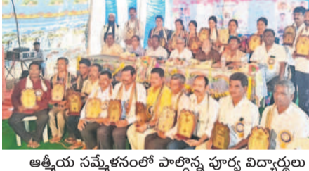
ఆత్మీయ సమ్మేళనంలో పాల్గొన్న పూర్వ విద్యార్థులు