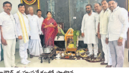
ఎంపీ కల్లూరి హరికృష్ణ, మాజీ జడ్పీటీసీ పబ్బామహేశ్వరి, ఎంపీ రమణాకౌంట్ రెడ్డి, మాజీ సర్పంచ్, మాజీ ఎంపీటీసీలు ఉన్నారు.