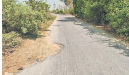
సూచిక బోర్డులు లేకుండా ప్రమాదకరంగా ఉన్న మూల మలుపు

నిత్యం ఈ రోడ్డులో ప్రయాణాలు సాగిస్తుంటారు. వెల్దుర్తి నుంచి పిల్లికొట్టాల వరకు ఉన్న రోడ్డులో పెద్ద పెద్ద గోతులు, చిన్న కాల్యాలతో పాటు రోడ్డు పక్కన ఉన్న మట్టి కొట్లుకు పోయి కయ్యలు కోసి ప్రమాదకరంగా ఉంది. ప్రమాదకరమైన రోడ్డు వెంట ప్రయాణిస్తున్న ప్రజలు ఎన్నో ప్రమాదాలకు గురవుతున్నారు. కొంతమంది ప్రాణాలు కూడా కోల్పోయారు. ఉదయం, సాయంత్రం వచ్చి పోయే బస్సుతో పాటు ఆటోలు, కొంతమంది ద్వీచక్ర వాహనదారులు మాత్రమే ఈ రోడ్డు వెంట ప్రమాదకరంగా ప్రయాణిస్తున్నారు. కొంతమంది ద్వీచక్ర వాహనదారులతో పాటు కార్లలో వెళ్లే వారు దూరభారమైన ఉప్పలింగాపూర్, గవ్వలపల్లి గ్రామాల మీదుగా మెడక్ వెళ్తున్నారు. ఎన్నో ఏండ్ల నుంచి రోడ్డును నిర్మించి ప్రయాణ వేతలు తీర్చాలని మండల ప్రజలు, నాయకులు కోరుతున్నారా రోడ్డు నిర్మాణం కలగానే సులభం. ప్రభుత్వం స్పందించి వెల్దుర్తి-మెడక్ ప్రధాన రహదారిని