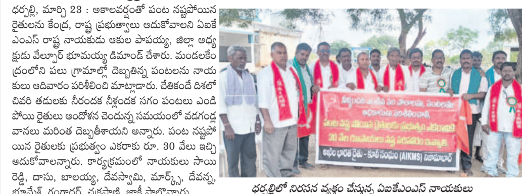
ధర్మలిలో నిరసన వ్యక్తం చేస్తున్న విజయవంతుల నాయకులు